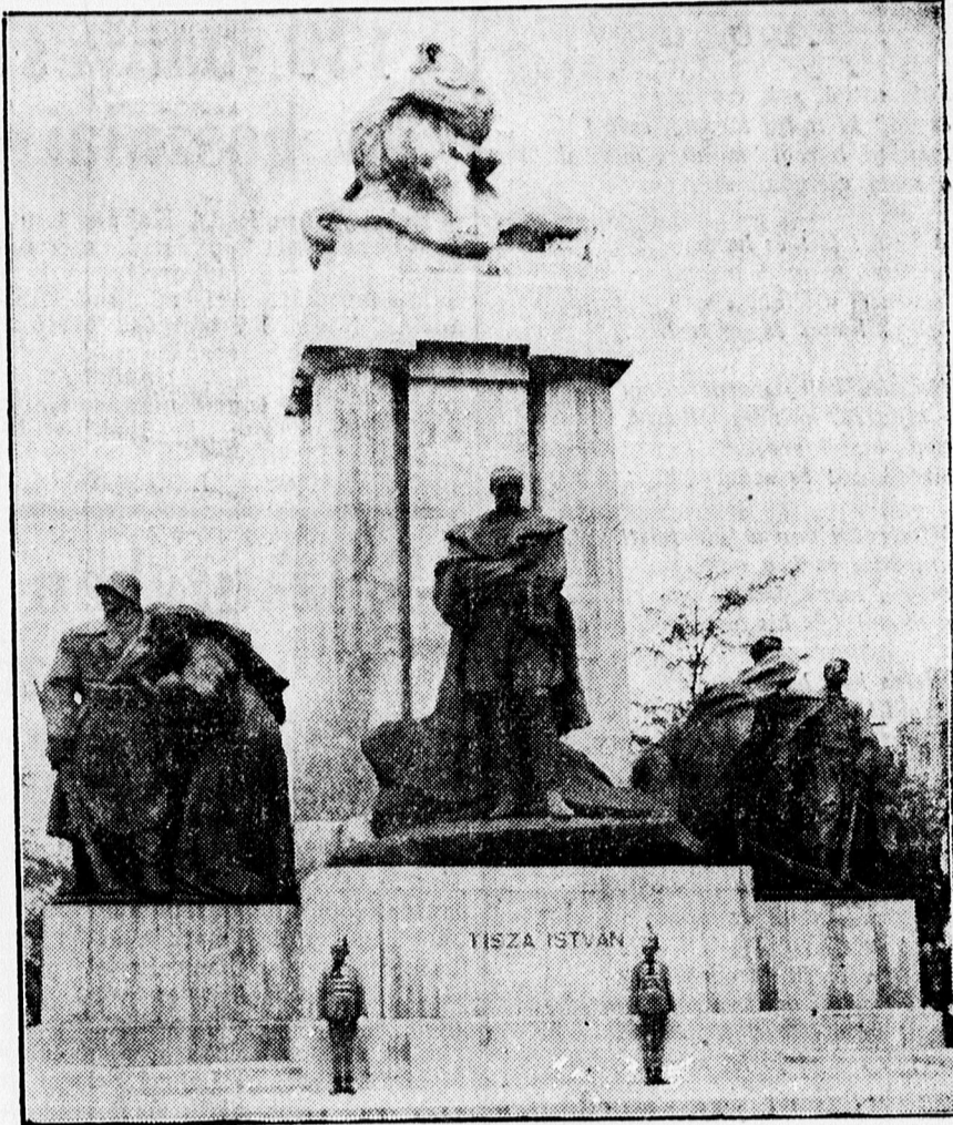
A BUDAPESTI TISZA-SZOBOR

ményből. 14 ház, melléképületeivel együtt porrá égett, sok malac és aprójószág pusztult el a tűzben, emberéletben nem esett kár.