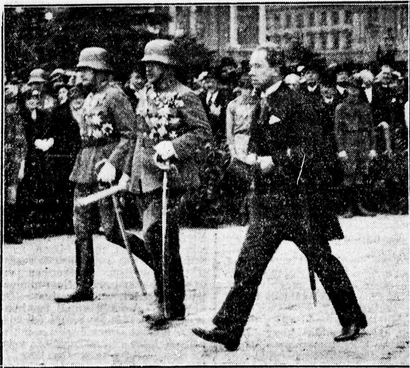
Albrecht, József és József Ferenc főhercegek a Tisza-szobor leleplezési ünnepélyén.