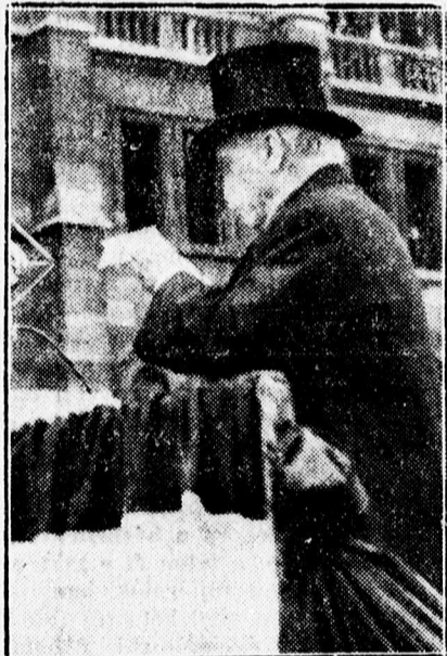
Berzeviczy Albert beszél a Tisza- szobor leleplezési ünnepélyén.

Megilletődve sietett fel a szónoki emléknyre Berzeviczy Albert, hogy