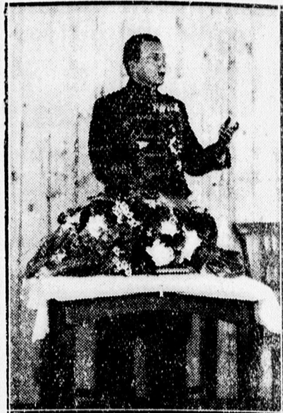
Vitéz dr. József Ferenc főherceg megnyitó beszédet mond.