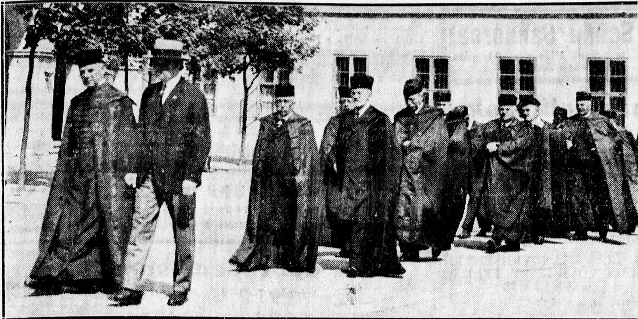
Az egyházkerületi közgyűlés lelkész -tagjai a lelkész-szentelésre mennek. Elöl Baltázár Dezső püspök és báró Vay László főgondnok.

kapcsolatban utalt ezután arra, hogy szomszédainknak politikája arra irányul, hogy olyan gazdasági helyzetet teremtsenek, amelyben azután térdre kényszerül. Ezért vetették el nyersanyagainkat és degredálták az országot de a magyar faj ebben a súlyos helyzetben is prosperál. Mindamellett külföldi utazásai során a tárgyalások homlokterébe a gazdasági kérdések megoldását tette. A római egyezmény éppen annyiban különbözik a többitől, hogy értékben állandó piacot keresett és talált is.