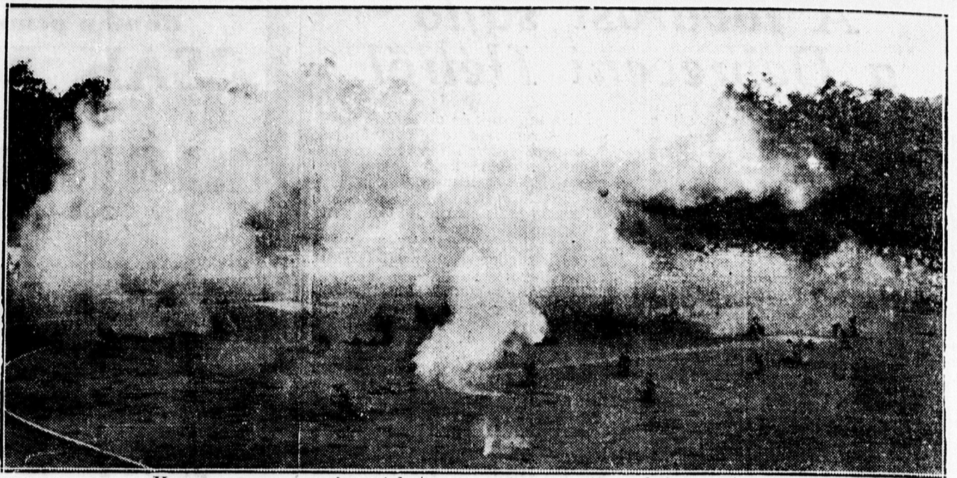
Haremozzanat a va sárnap katonai sportnapon. Gázfel hőben a Stadion.