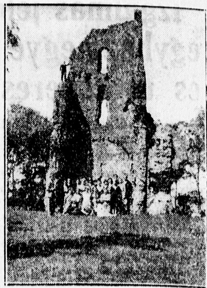
A Mester utcai egyházrész leány-körének kirándulói Zeleméren.