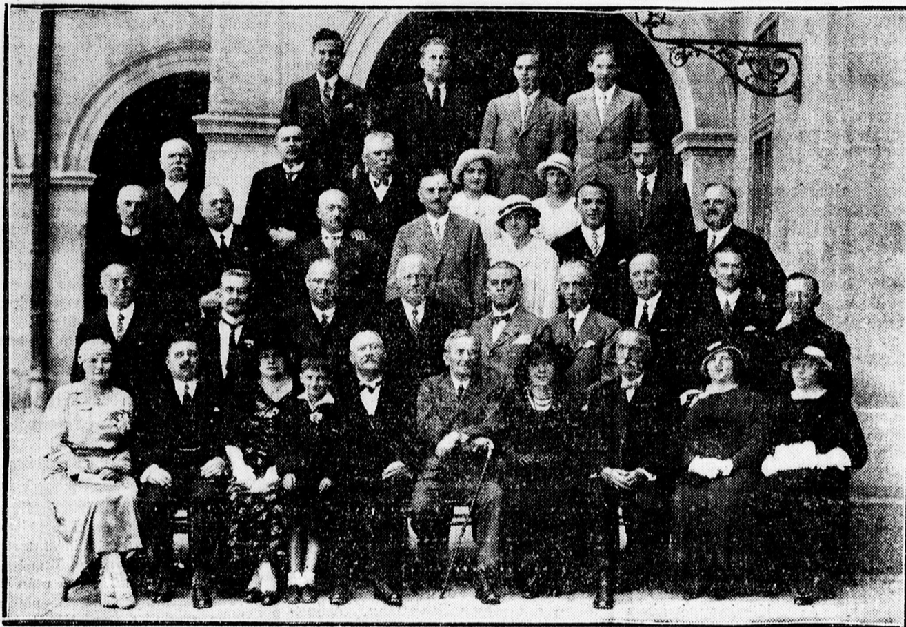
A debreceni református Kollégiumban 1904. évben érettségizett öreg diákok harminc éves találkozója 1934. évi június hó 24-én.

X FELVÉTELEK? LIENERNÉL, CSAPÓ UCCA 1. — FOTÓCIKKÉK LIENERNÉL, CSAPÓ UCCA 1. SZÁM.