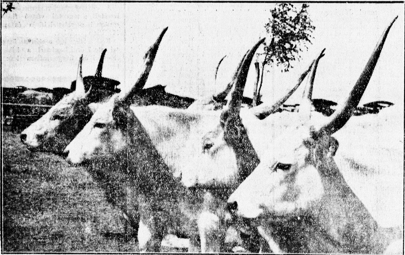
Elkelj jóságok az új gazdát várják.