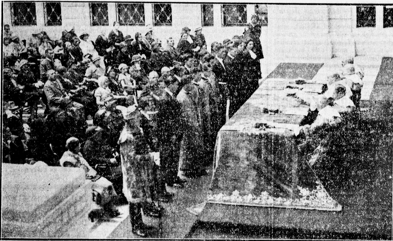
A DOKTORRAAVATÁS AKTUSA.