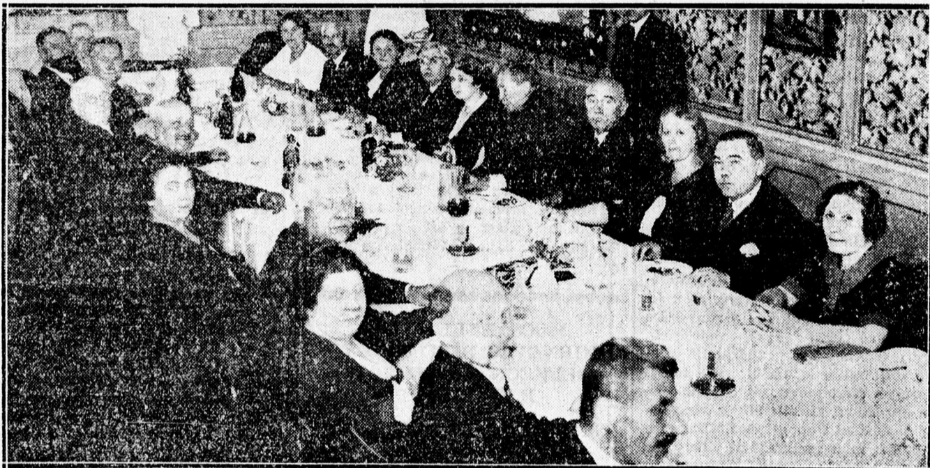
A 35 éves érettségi találkozó résztvevői közös ebéden az Angol Királynőben.