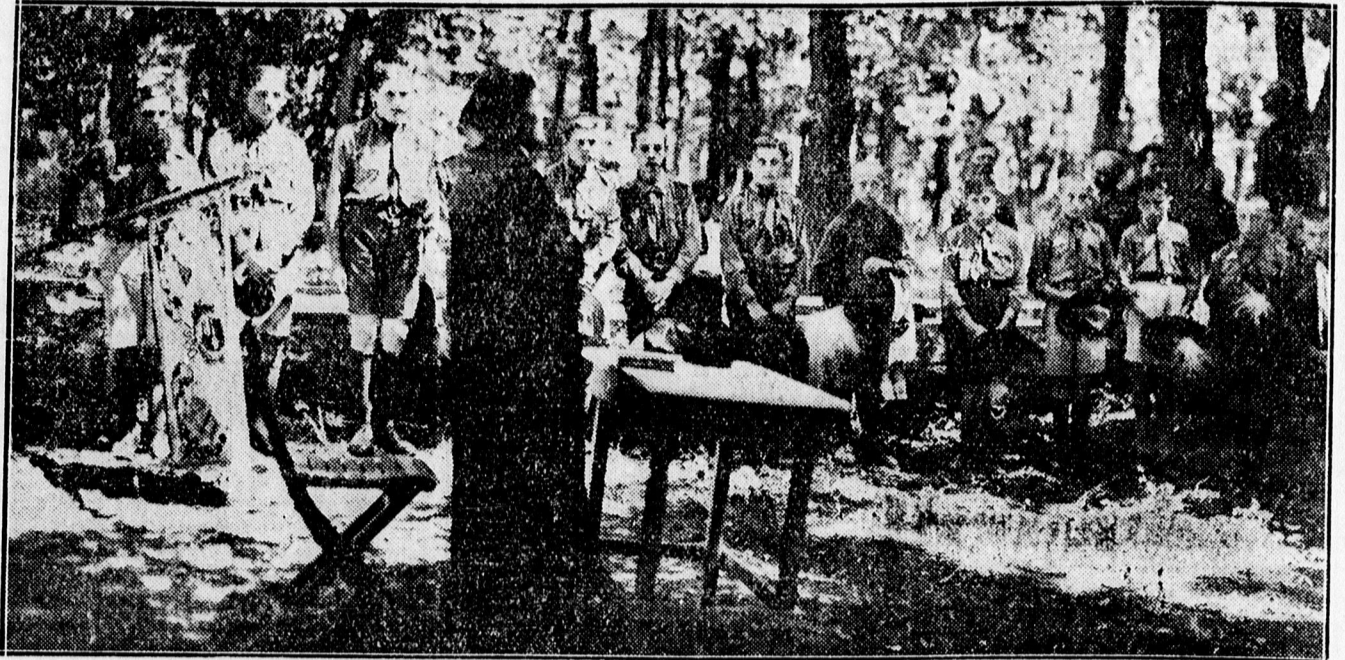
Istentisztelet az erdőben a „Révész Bálint“ cserkészcsapat táborozásán.