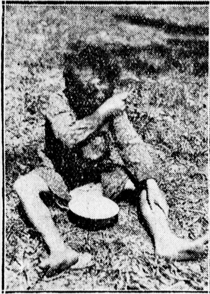
Egy kis nyaraló gyerek ebédel.