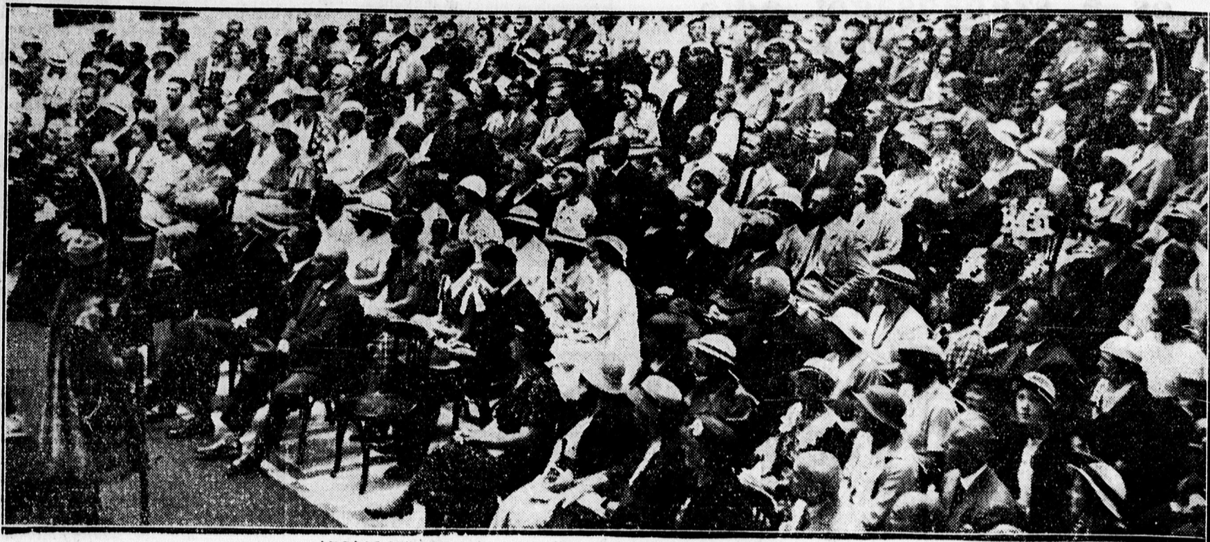
ÓRIASI KÖZÖNSÉG A NYÁRI EGYETEM MEGNYITÁSÁN.

Tegnap délelőtt 10 órakor ünnepélyes keretek között nyílt meg a Nyári Egyetem tanfolyama, mely ebben az esztendőben éppen nyolcadik évfolyamába lép.