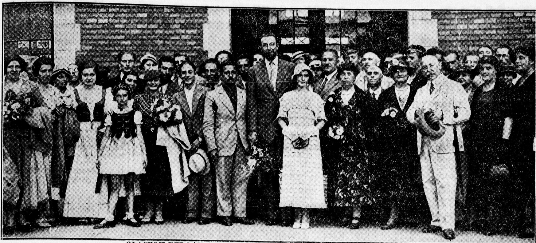
OLASZOK BELGÁK, FRANCIÁK FOGADÁSA AZ ALLOMÁSON.