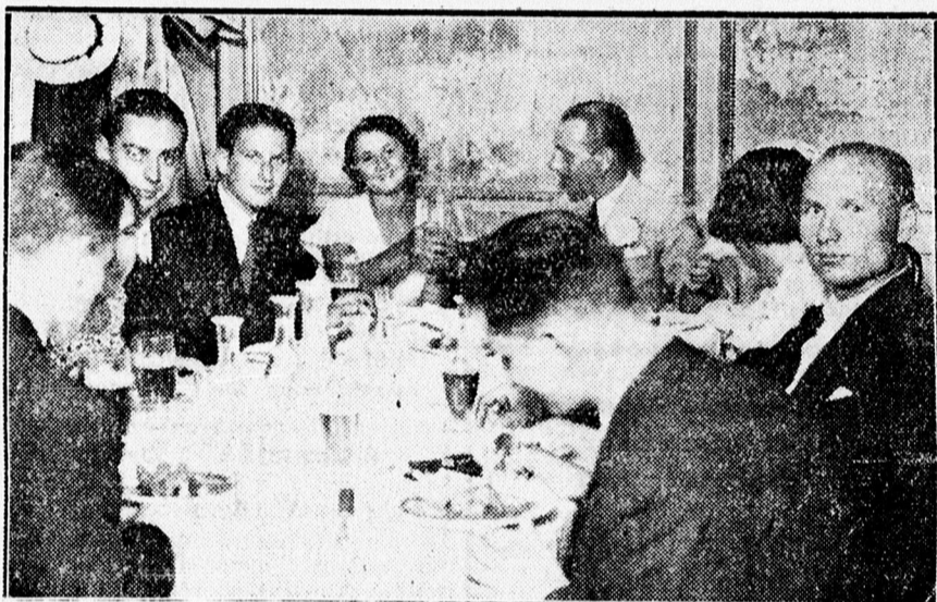
Olaszok vig poharazása az Angol Királynöben megtartott ismerkedési estélyen.

Holnap, vasárnap a Hortobágyra megy kirándulásra a Nyári Egyetem hallgatósága. Indulás délben. Részvételi díi 3 P.