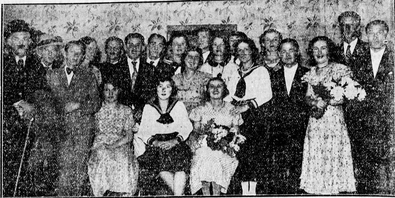
A vasárnap nagy sikerrel szerepelt Kerekeselepi mükedvelők

— Egy szerencsétlen asszony kérelme. Felkereste a szerkesztőségünket egy szerencsétlen sorsu, valamikor jobb napokat látott 5 gyermekes anyja, aki eláldta, hogy annyira nagy nyomorban él, hogy apró gyermekeit butor és ágy hiányában a csupasz földön altatja. Kéri a jó szívű embereket, hogy akár ócska ágyneműt vagy használt ágyneműt juttassák el a kiadóbeli címére.