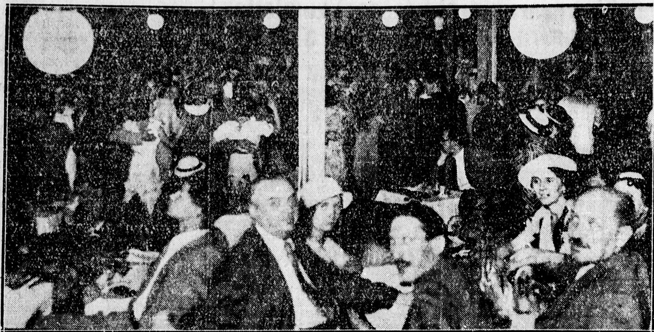
Pillanatképe a nagyerdő Vigadóban rendezett Tündéréjszakáról.