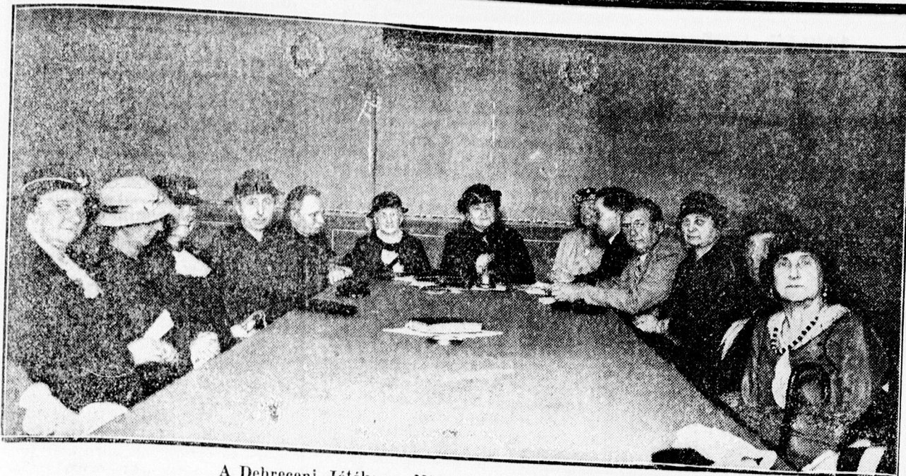
A Debreceni Jótékony Nőegylet választmányi üléséről.