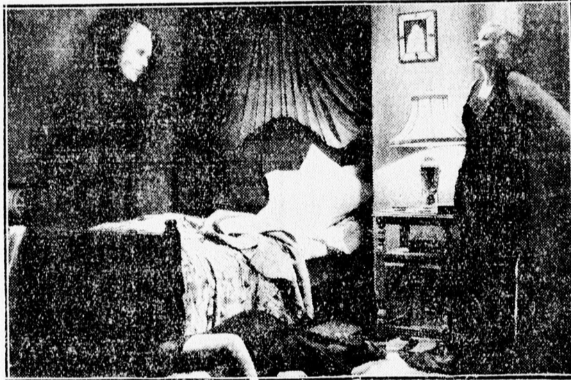
Jelenet a Fantomból, Vigaszínház.

Nyugodtan nevezhetnénk a borzalmak filmjének is ezt a képet. Ideg kell hozzá, hogy végignézhessük úgy, ahogy azt a rendezői fantázia megálmodta. Csupa fantázia ez a film, mégis tele van az életből merített le-