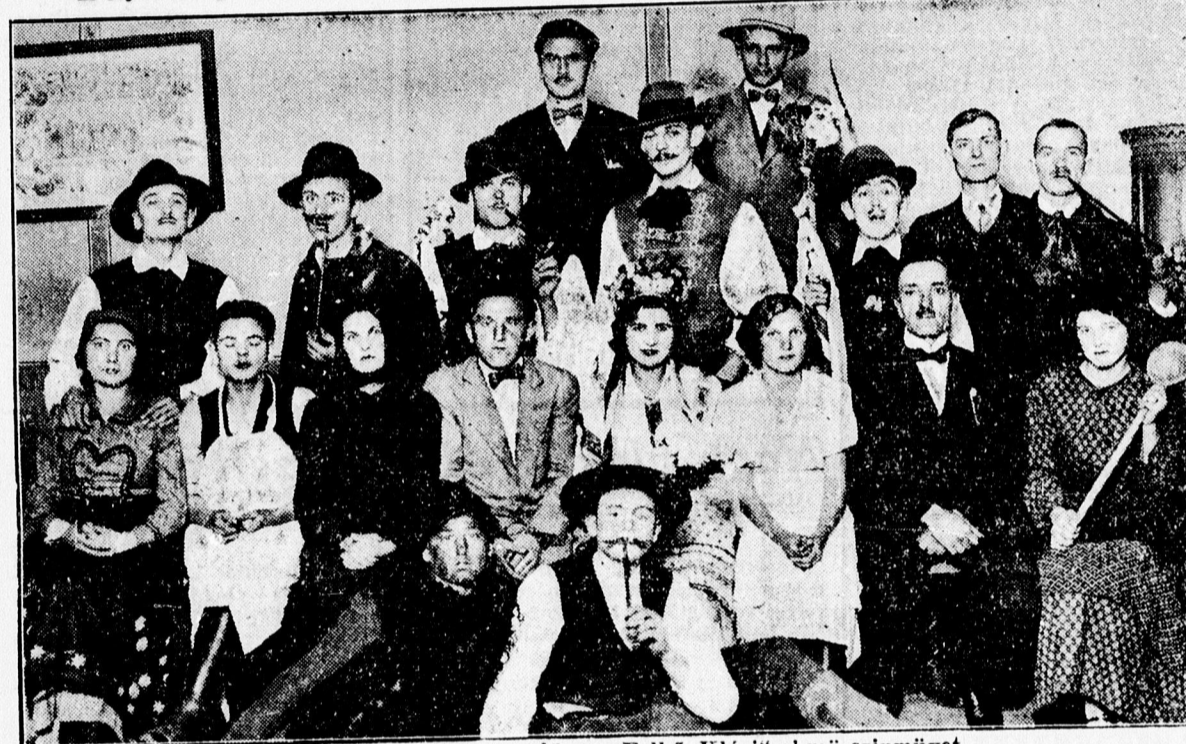
A Csapókerti Olvasókör nagy sikerrel adta elő a „Felhő Klári” el mű színművet.