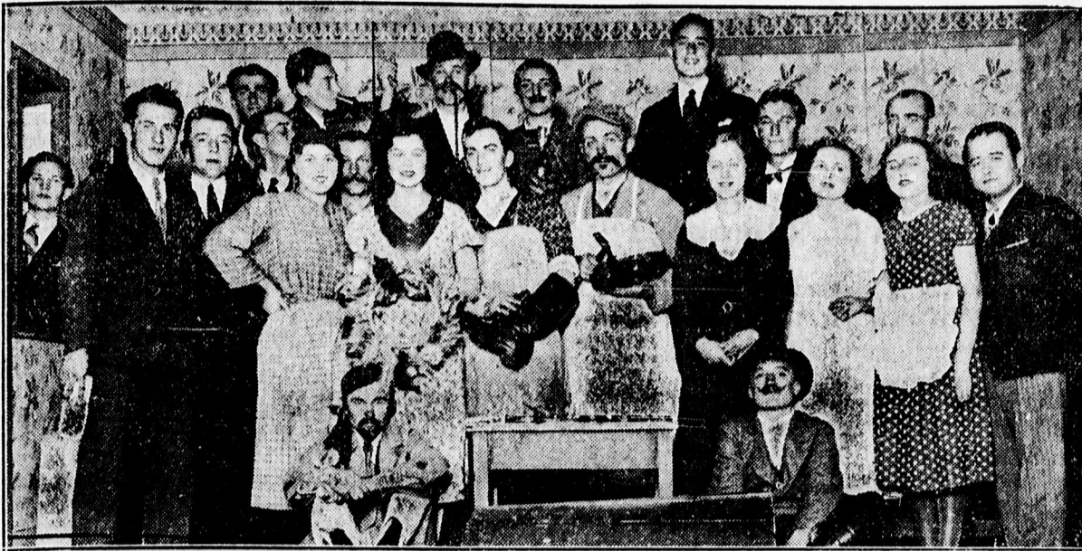
A Kerekestelepi Olvasókör nagy s ikerrel adta elő »Csizmadia mint k isértet« című 3 felvonásos énekes népszínművet.