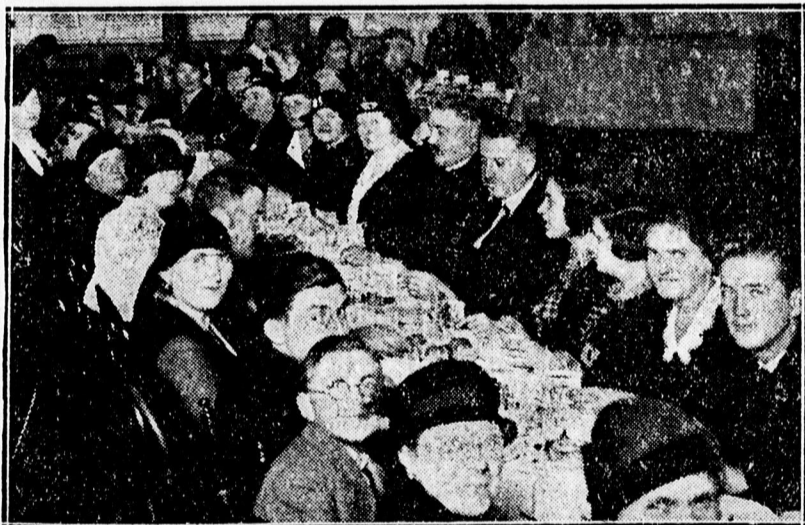
Mester necai egyházszer szeretetve ndégsége a Kollégium diszudvarán