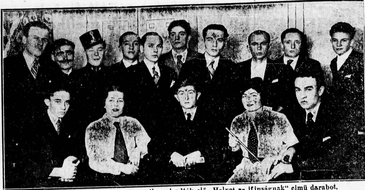
A Nyilastelepi Kulturházban nagy sikerrel adták elő „Helyet az ifjúságnak” című darabot.

— Bibliaköri híradás. A Kossuth uccai egyházzrés kezében működő női bibliakör összejöveleleit minden hó első keddjén, délután öt órakor tartja a régi Dóczy intézet rajztermében, (Kossuth ucca 33.) első összejövelelét ma, kedden délután öt órakor rendezi meg. Ez összejövelelen bibliát magyaráz s állandóan vezeti Baja Mihály lelkipásztor. Az egyházzrés vezetősége ezuton is szeretettel hívja meg az egyházzrés minden érdeklődő női tagját s vendégeket is szívesen lát. A bibliaköri órákán megbeszélések tartanak.