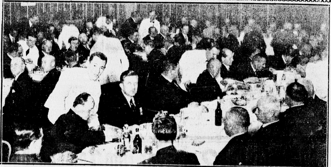
A vitézek köz ebédje a rendházavatás után az Arany Bikában.