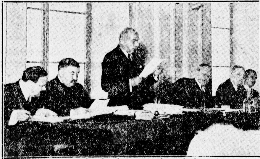
Az egyházkerületi közgyűlésről. Az elnökség.

másközötti és belső életében a jognak igazságnak és hitnek eszményei mind jobban elhomályosulnak s a nemzeteszme különleges értelmezése mellett az erőszak kiváltsá-