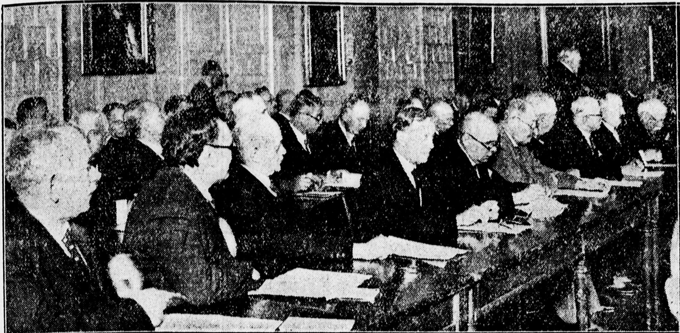
Az egyházkerületi közgyűlés tagjai.