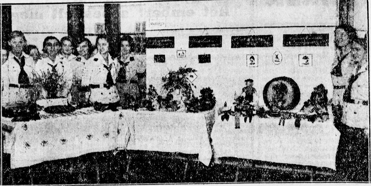
Tisza Ilona eserkészcsapat karácsonyi vásárt rendezett a Dóczy-intézetben Képünk a vásár egyik részletét mutatja be a cserkészcsapat kedves tagjaival.