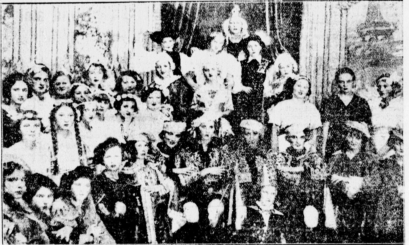
A Dócei leánygimnázium díszelőadásának szereplői a Csokonai színházban.

x Nézze meg Lienér kirakataiban, milyen olesó és csodaszép ajándékkal lepheti meg hozzátartozóit karácsonyra!