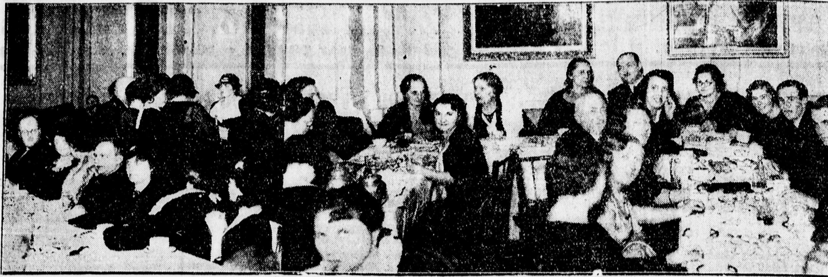
A Kálvinista Templomegyesület teasztélyéről.