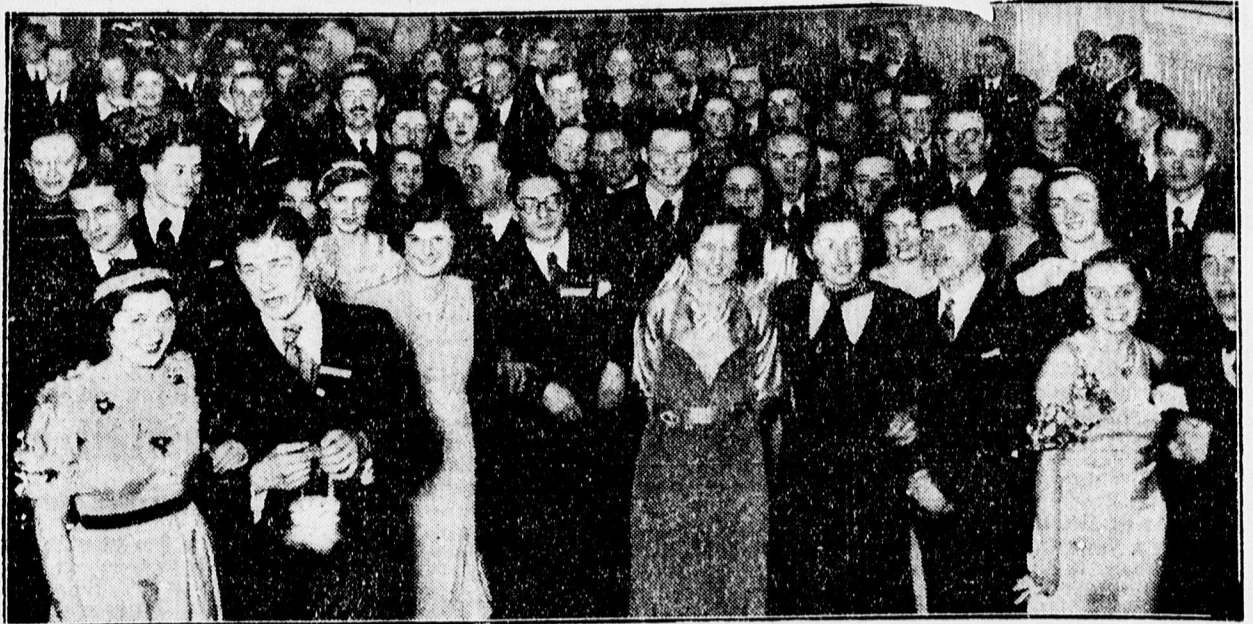
Táncos csoport a Mansz estélyen.