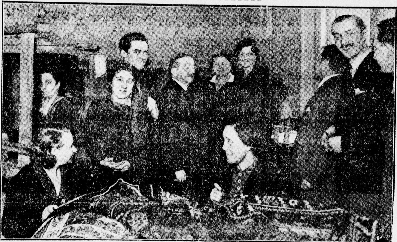
Látogatás a Mansz foglalkoztató m'helyében.

Feleség: Nem hiszed? Gyere velem, nézd meg a kirakatát, kint vannak az árak.