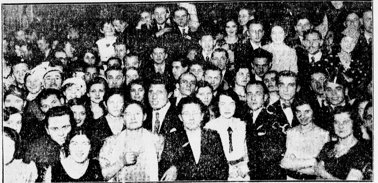
Szabók bálja a Munkás Otthon disztermében.