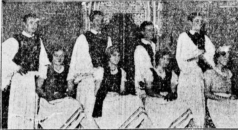
Magyar táncot lejtő párok az ipariskola előadásán.