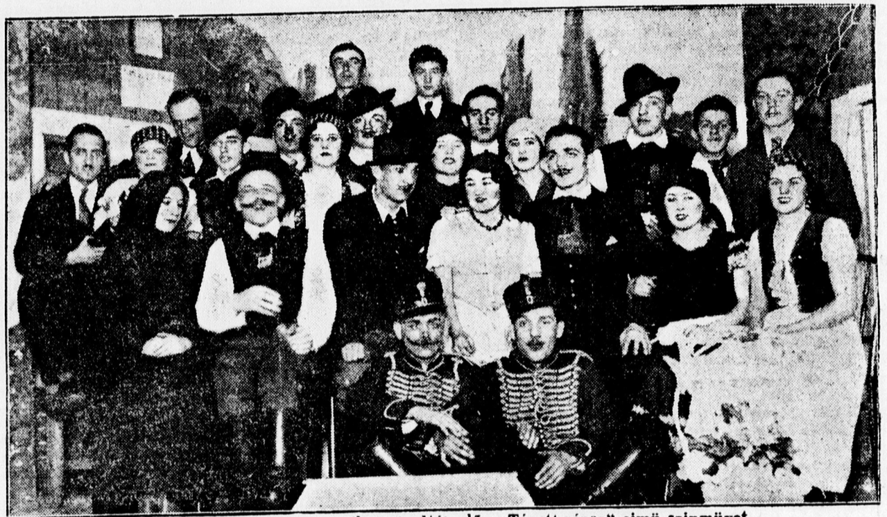
Nyilastelepi kulturháza nagy sikerrel adták elő a „Tépett rózsák” című színművet.

— Igyekezzék kthaszónál modern- vált műtermünk expanziós művészi képeit, Liener, Csapó uca 1.