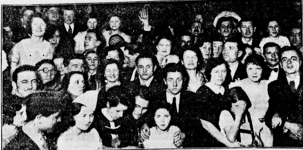
A Dohány gyári Dal- és Sportegyelet által rendezett mulatságról.