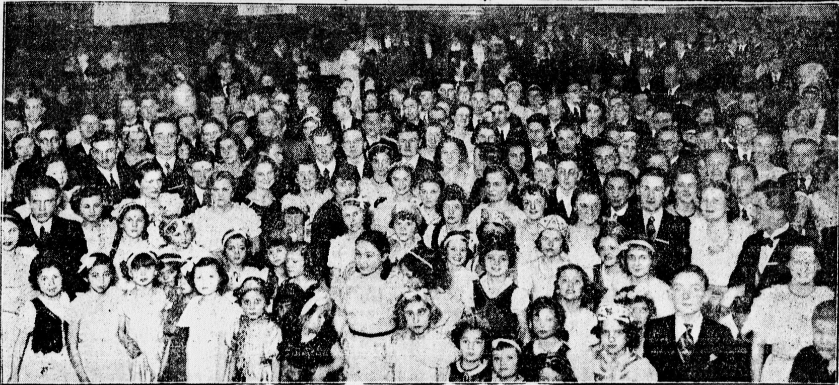
Fiatalság a Lilla-estélyen az Arany Bika dísztermében.

Most vásároljon nálam, sok pénzt megtakaríthat!!!