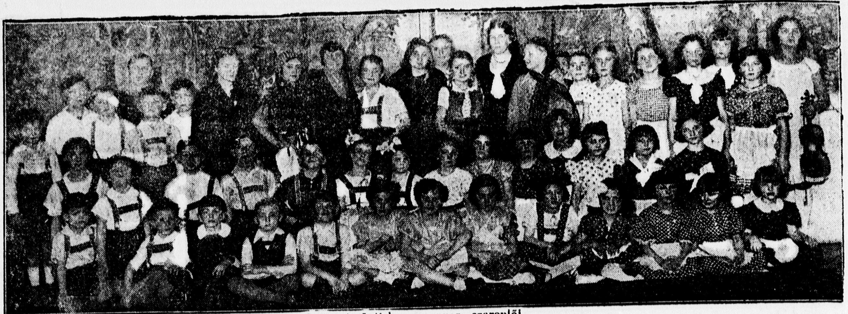
Jancsi és Juliska meseopera szereplői.

A világ legnagyobb koloratur énekesnője: