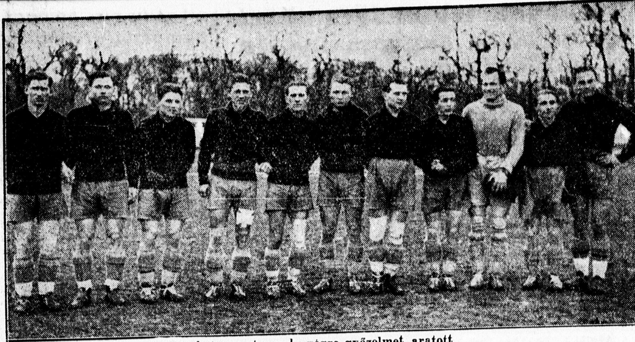
A Bocskai csapata, mely végre győzelmet aratott.