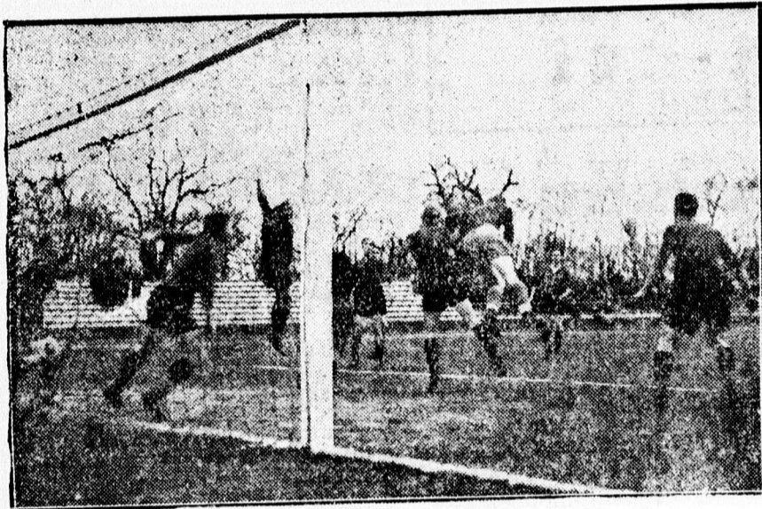
Meleg helyzet a „So mogy” kapuja előtt.