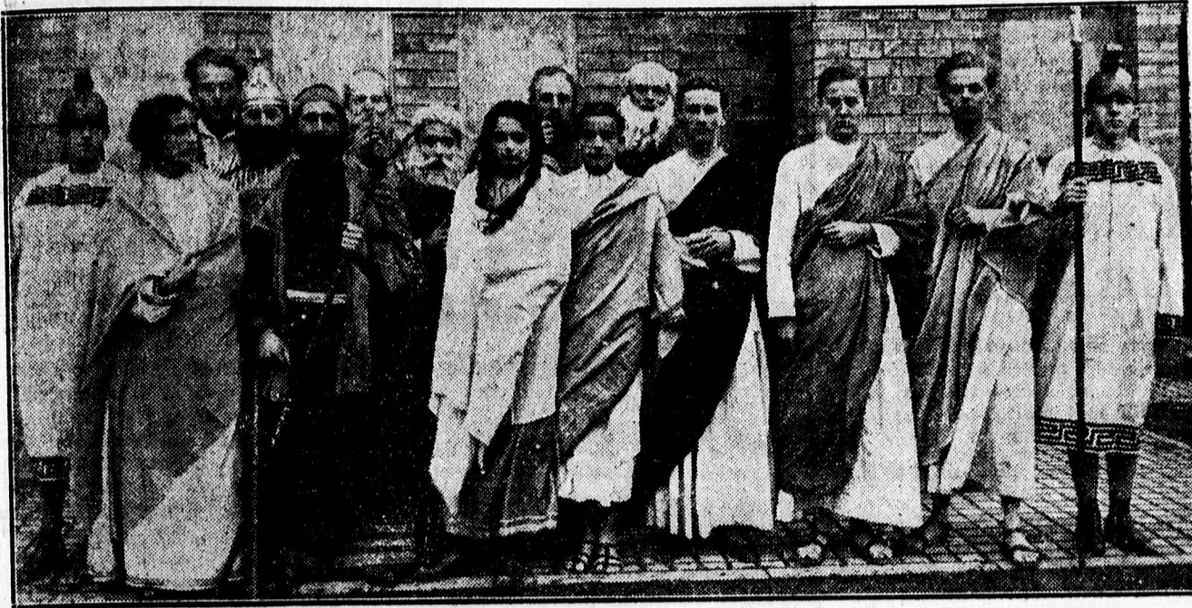
A Horatius emlékkünnepély szereplői a ref. főgimnáziumban.

Kerékpárt? Természetesen Soltész-tól Kálvin-tér 2 szám. WAFFENRAD, PUCH, STYRIA, SUPERRAD, CSEPEL