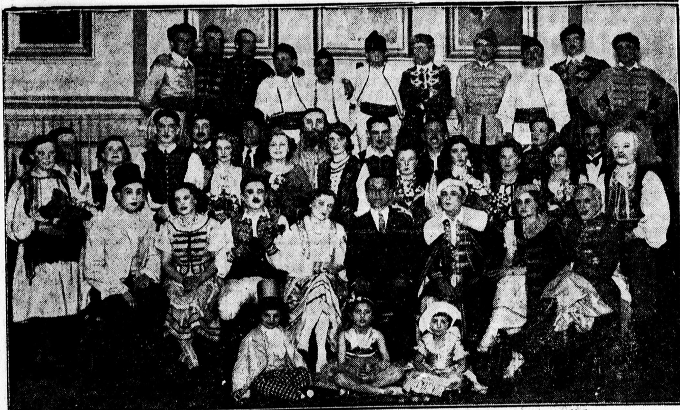
A vasongyári művevelok nagy sikerrel adták elő a „Cigány szerelem” 3 felvonásos operettet.