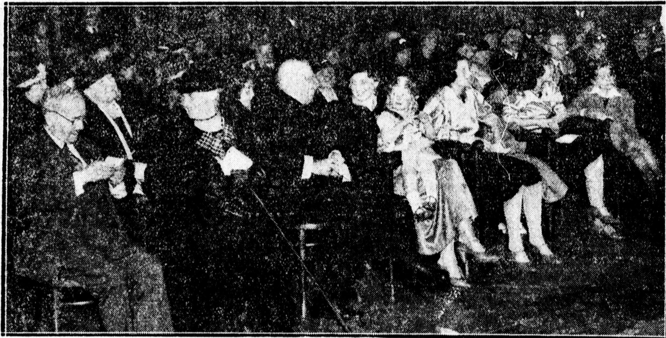
A zűnnepély közönsége.

gyerekek felvonulását. Elöl hozták az elmúlt esztendőben megnyert vándordíjat a pompás zászlót, ami melle nemzeti lobogót tartott egy magasabb gyerek.