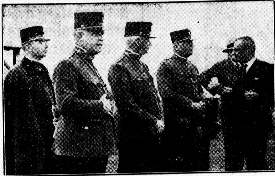
Előkelőségek a galambblövő versenyen.