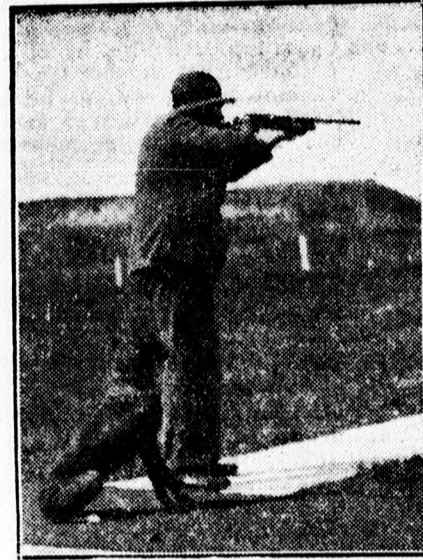
Szomjas L. lő.

— Legszebb májusi zenét vállal Amith testvérek zenekara „Korona” vendéglő.