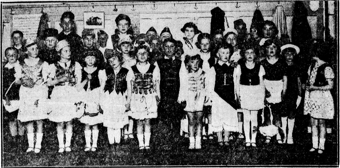
A MÁV kolóniabeli elemi iskola jól sikerült Vöröskereszt ünnepélyéről.

megvásárolt tárgyakat saját költségükön azonnal elszállítani tartoznak anynyival is inkább, mert a hatóság azoknak további megőrzéséről nem fog gondoskodni.