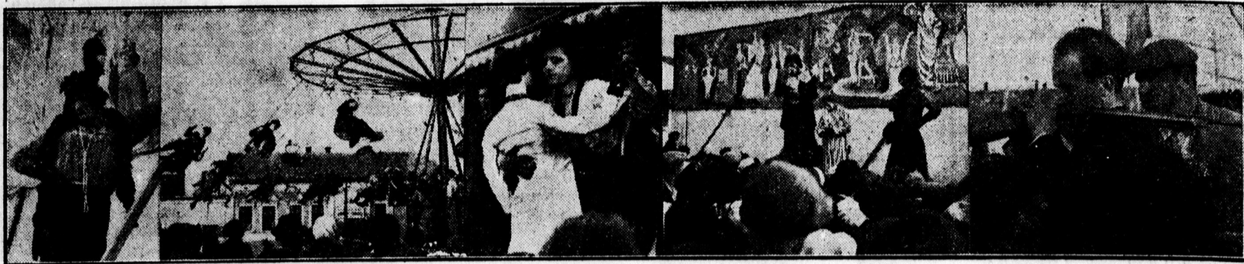
Démon. „Ringlispil”. Táncbemutató — rongybábuval. Közönség toborzás a mutatványos bódé előtt. Célhalvés tükörből háttal.