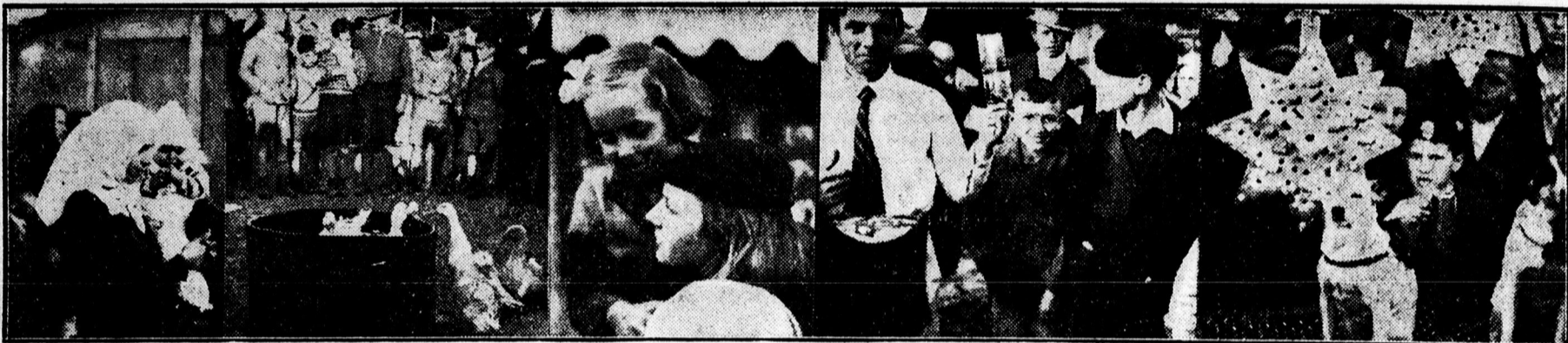
Legjobb a mézes. Karikadobás a kacsá nyakára, aki rádobja, azé a kacsá. ... de érdekes! ... Szép a fénykép. Plánétahúzás kutyával.