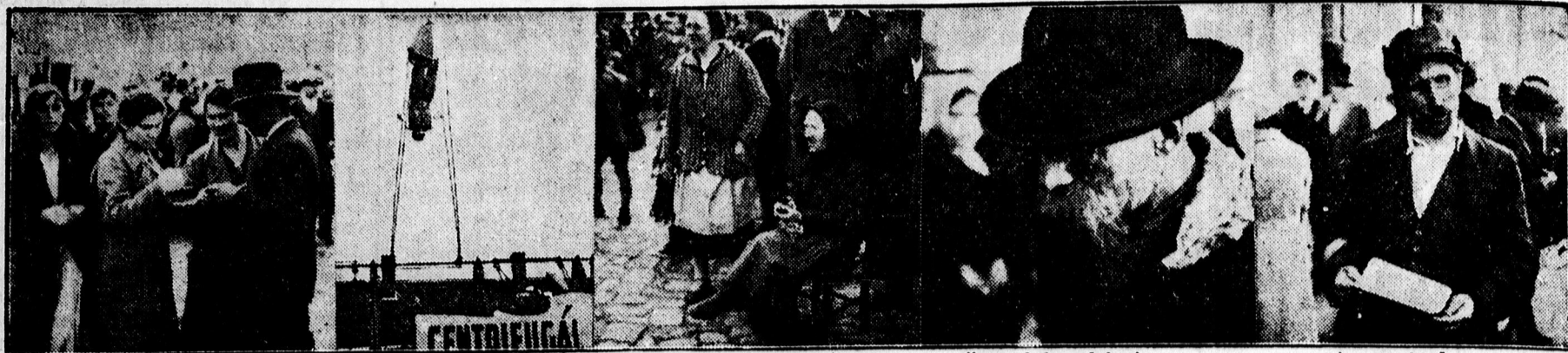
Jól sikerült a gyorsfénykép. Fejjel lefelé a hajóhintán. Karikadobáló: pénztárosa. Öreg falusi bácsi. A vak énekes.