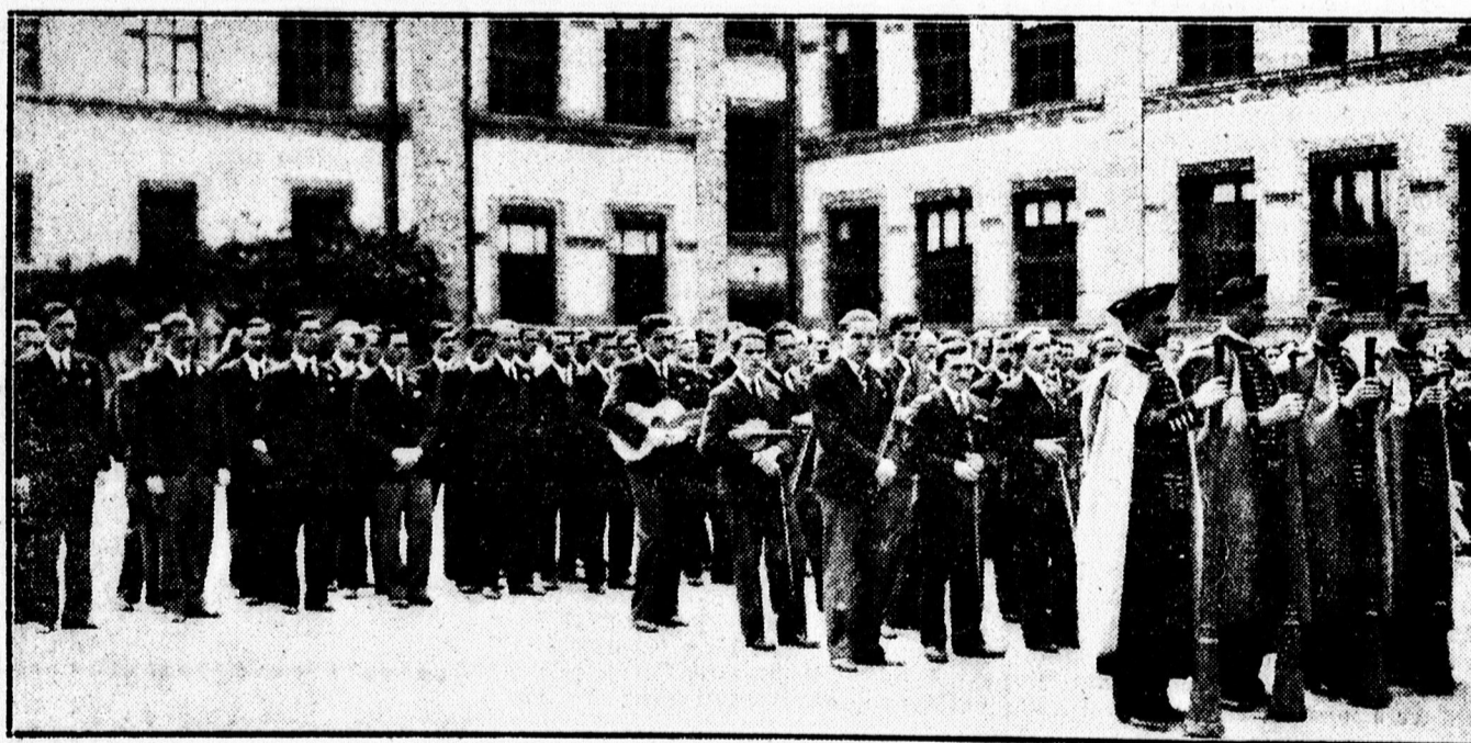
A végzett növendékek csoportja.

Könyvszelvény „DEBRECZEN” előfizetői részére.