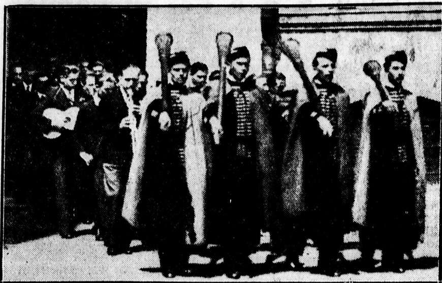
Gerundiumos diákok a ref. gimnázium VIII. osztályos növendékeinek búcsúba llagásán.

— Felhívás a MEFHOSz taggyesületéhez. A MEFHOSz elnöksége felhívja a taggyesületeinek figyelmét arra, hogy szombaton délután hat órakor levő szokásos tanácsülésen, minél nagyobb számban jelenjenek meg, annál is inkább, mivel ekkor lesz részletes beszámoló a XVI. országos kongresszusról.