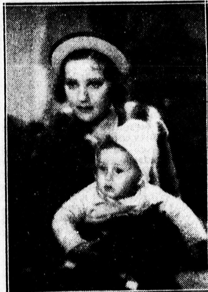
A lelencház kapujában talált gyermek és a megtaláló fényképe.

szabadulni tudjon a gyanú alól és bizonyítani tudja ártatlanságát. A gyermekmenhelyen elhelyezett gyermeknek az anyját keresik, mert csak ő bizonyíthatja be, hogy ártatlanul került megszegyenítő helyzetbe — egy végzetes félreértés miatt.