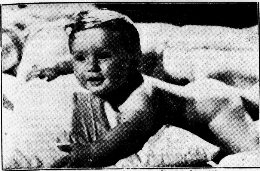
Ezt a kis gyermeket találták a lelencház kapujában.

A szerencsétlen, ártatlanul meghurcolt leány most támogatást kér, hogy