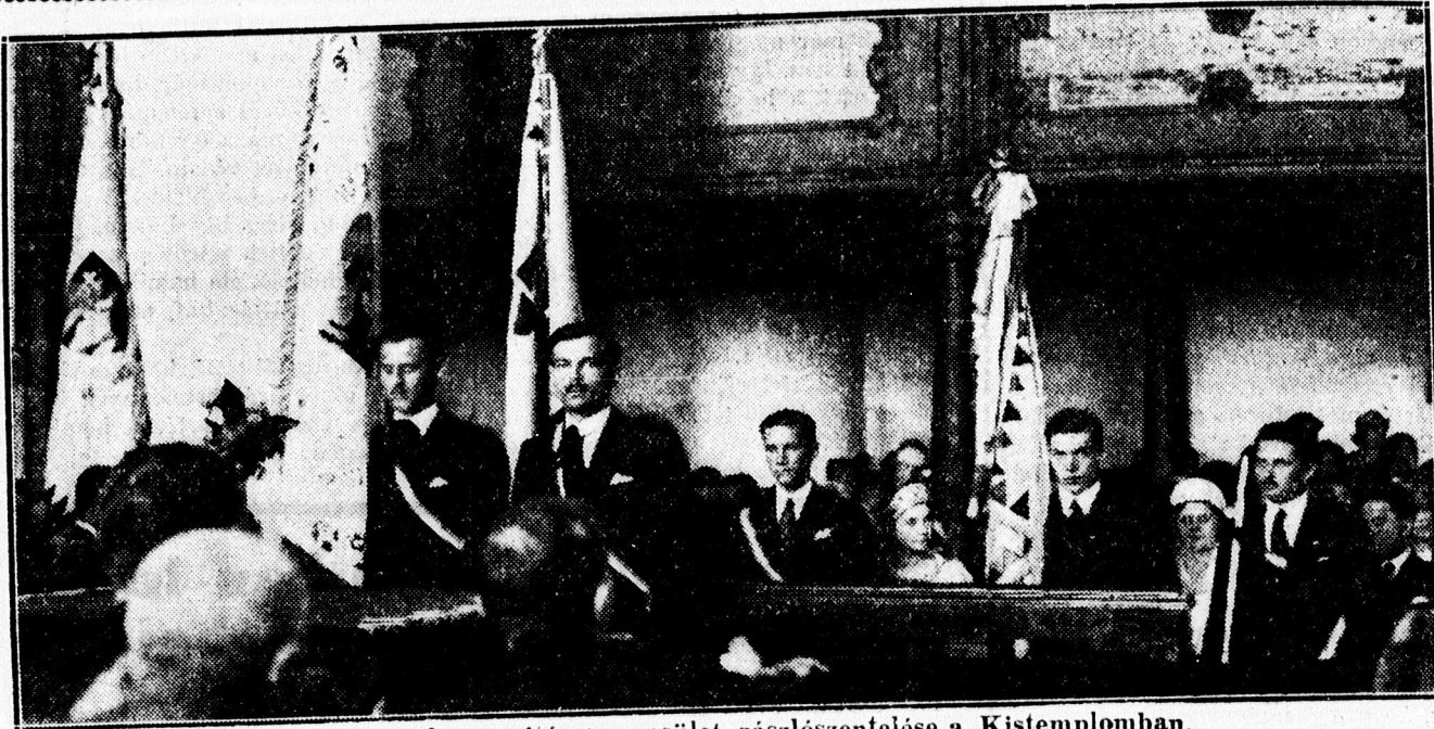
A Boeskaai bajtársi egyesület zászlószentelése a Kistemplomban.

x Legelősebben kifogástalanul festés és tisztít mindennemű férfi- és nőruhákat WEISZ, Arany János uca 20. Egy férfiöltöny tisztítása és vasalása három pengő.