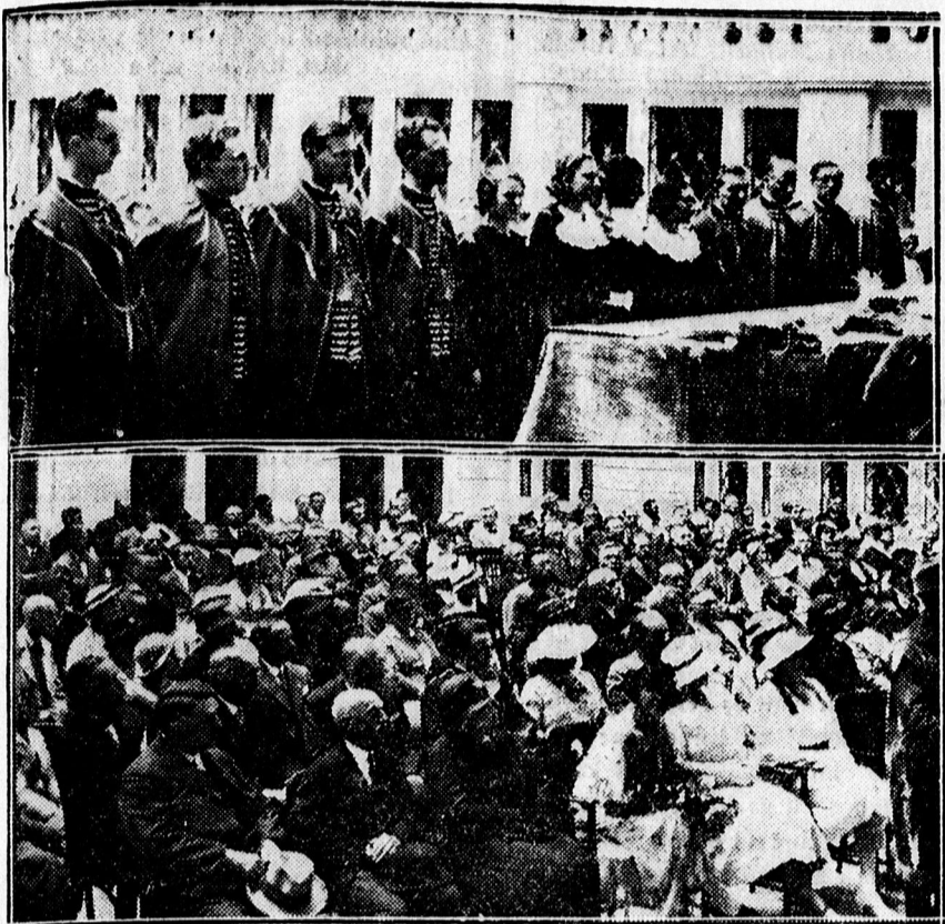
Doktorráavatás a debreceni egyetemen. Fent: Az új doktorok. Lent: A doktoravatási ünnepelely közönsége.