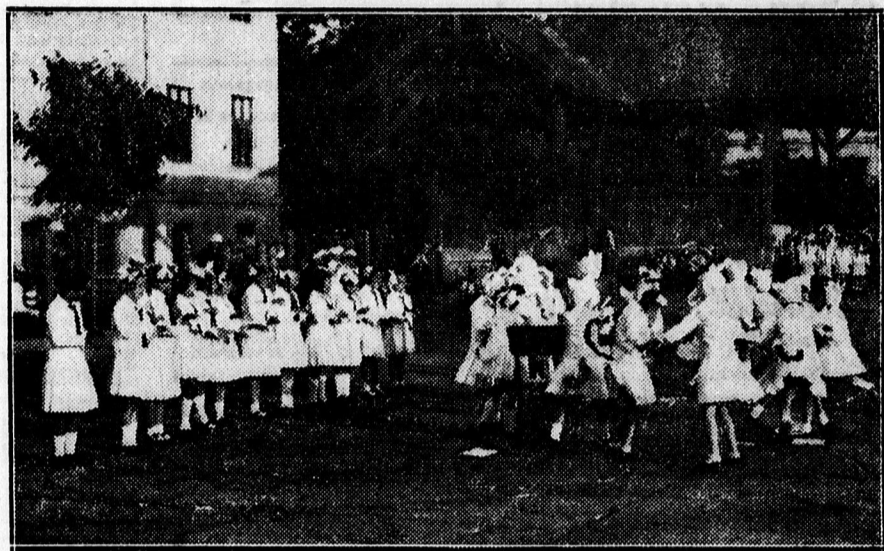
A „tudós macskái” a Dócei elemi iskola tornavizsgáján.

minden arcot vonzóvá és széppé tesznek. Ha szép fehér fogazatot óhajt, úgy tisztítsa fogait reggel és este a pompásan üdítő ízű Chlorodont-fogpasztával. A fogak már rövid használata után is gyönyörű elefántcsontszerű csillogást kapnak. Tubusa P —.54 és P —.90.