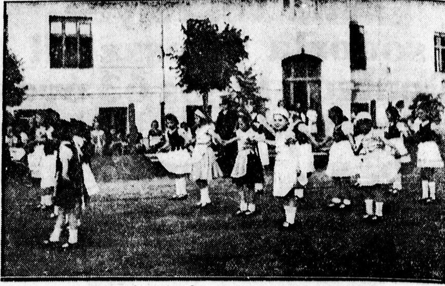
A Dóceji elemisták körm agyart táncoló csoportja.