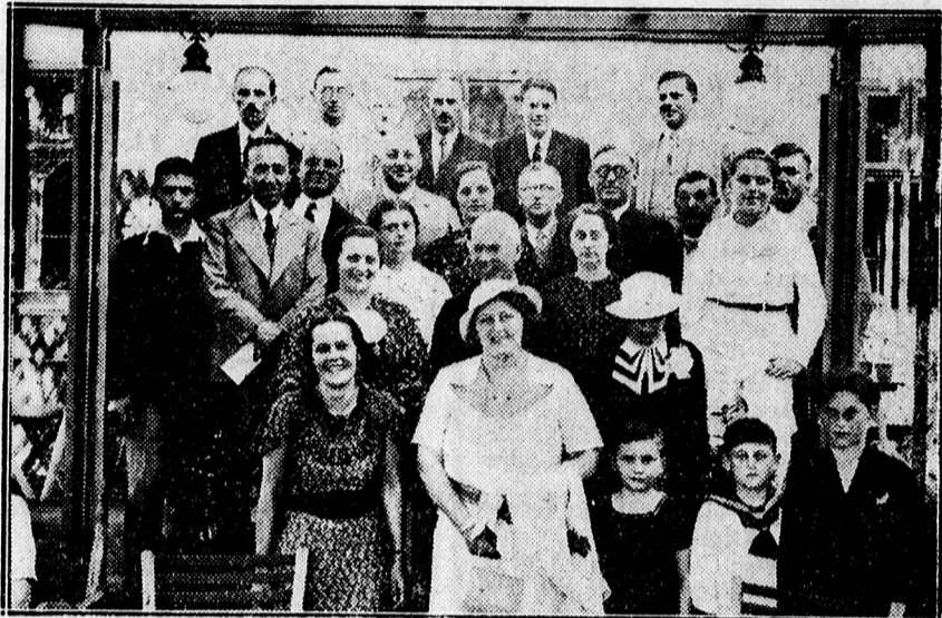
Taálkozóra jöttek össze azok, akik 25 évvel ezelőt végeztek a debreceni Fiu Felső Kereskedelmi Iskolát. Az egykori iskolatársak s családtagjaik

után leforrázzák és elkülönítve tartják.