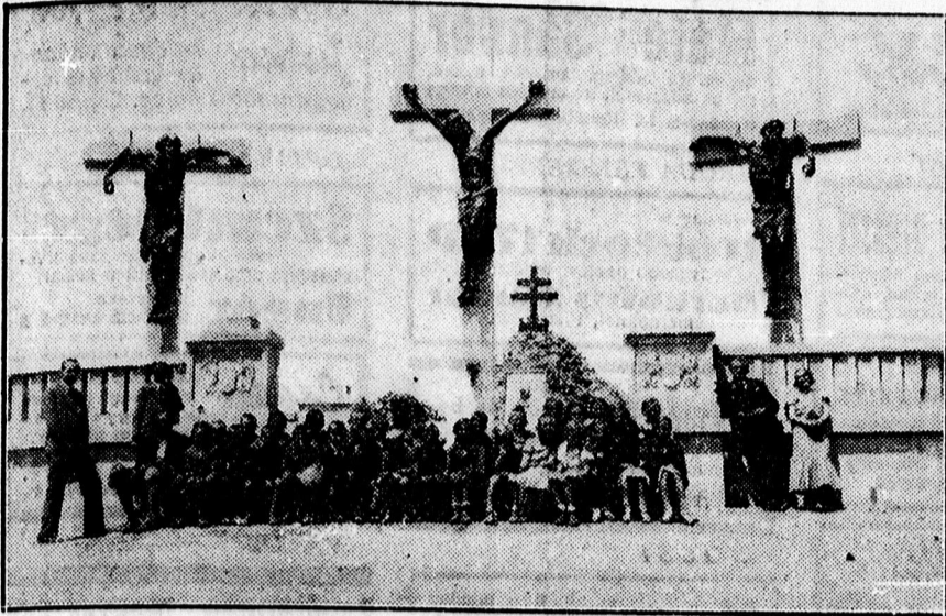
Tihany, A „Magyar kálváriá”-nál.