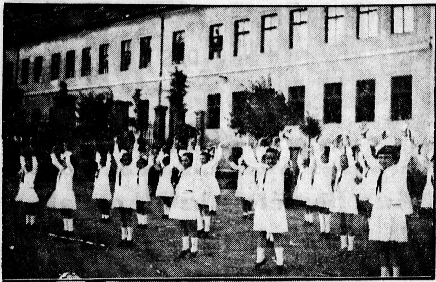
A Dóceji elemi iskola IV. osztályának szabadgyakorlata.