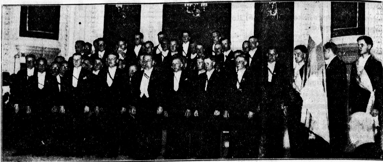
Finn énekkar, mely Debrecenben is vers enyzzett.

— Időjárás. A debreceni egyetemi meteorológiai intézet jelentése: Az óceáni áramlás állandósulásával Közép Európa időjárása erősen változó jellegű lett. A hőmérséklet nyugatról újabb súlyedőben van. Hazánkban az ország nyugati részében már az éjszaka folyamán megindult a hűvösebb levegő behatolása. A határszélen a reggeli órákig 10 mm-t meghaladó eső esett. A hőmérséklet legalacsonyabb értékei 12—15, a legmagasabbak nyugaton 20—22, keleten 27—30 fok között váltakoztak. Az időjárás elemek debreceni értékei: minimum 11.4, maximum 24.4, este 6 órakor a hőmérséklet 23.0 fok. A tengerszintre átszámított légnyomás pedig 761.3 mm., gyengén súlyedő irányzattal. Prognózis: Északnyugati északi szél, felhős idő, zivataros esőkkel és hősúlyedéssel.