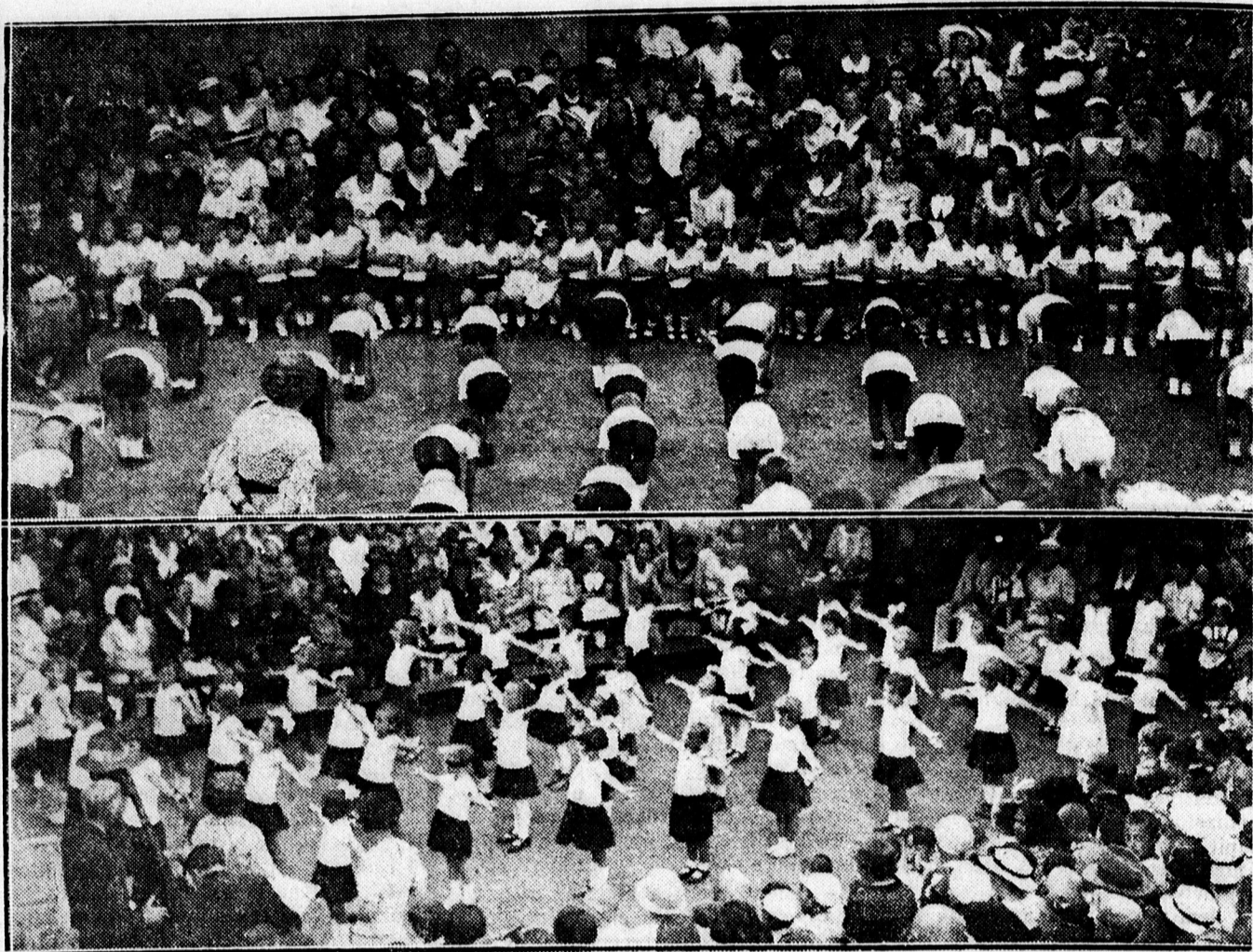
K épek a Timár uccai ovoda vizsgájáról.

— Nagyon pecsétes a ruhája? Küldje Brosához a Piac uccába Fest, tisztít, mos. Piac u. 77.