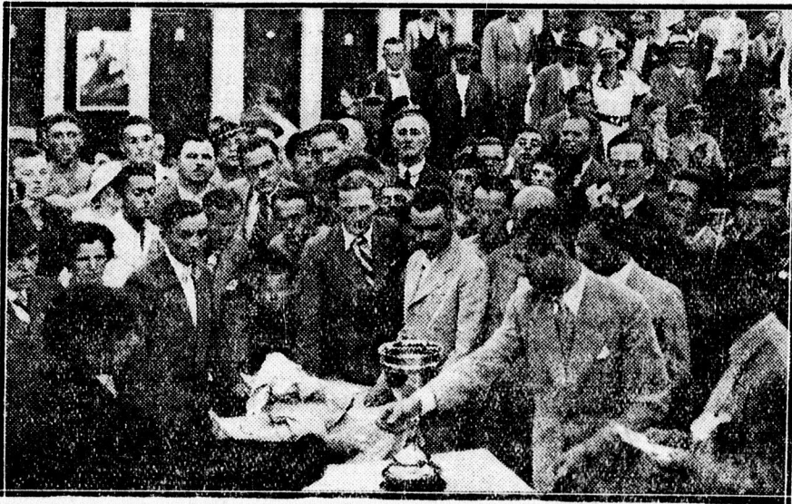
Ifj. Horthy Miklós, a MUSZ elnöke kiosztja a díjakat.

— Autós szélhámosságok csalják végig a tanyákat. Autós szélhám- osságok garázdálkodnak a Bácskában. Végigjárják luxusautóikkal a tanyákat és szöveteket kínálnak a gazdáknak potom áron. Azt állít- ják, hogy a budapesti vásárról visszamaradt olasz áruk, amelye- ket a nagy vám miatt nem akar- nak visszazállítani. Sok gazdál- kodó atadja a pénzt a szövetért, mire a szélhámosságok hirtelen „rá- kapcsolnak” a gépre és elszágul- danak, mások pedig, akiknek at- adták a szövetet, megállapították, hogy egészen silány minőségű, er- téktelen holmit kaptak.