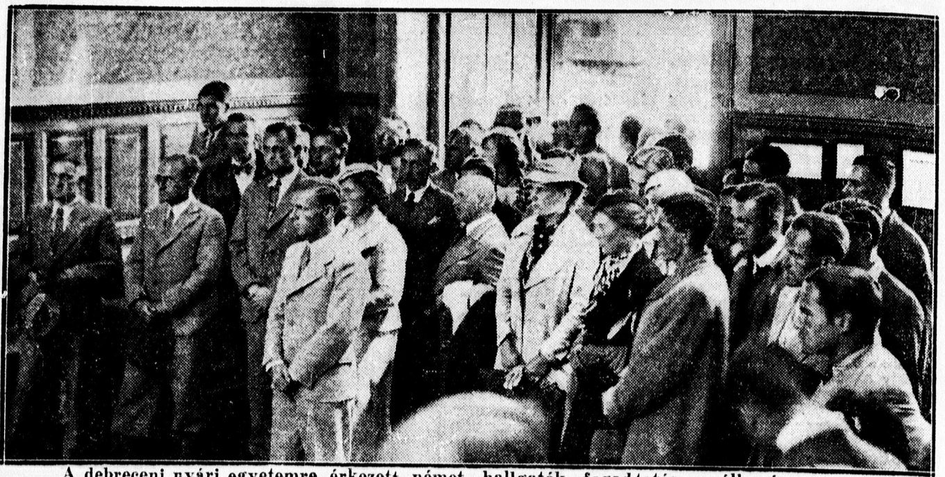
A debreceni nyári egyetemre érkezett német hallgatók fogadtatása az állomáson.

— Felhívom a Nemzeti Egység leánycsoportját, hogy augusztus hó másodikán, azaz pénteken délután négy órakor tartandó igen fontos megbeszélés végett az Arany Bika kistermében pontosan, minél nagyobb számban megjelenni sziveskedjenek. Leánycsoport titkára.