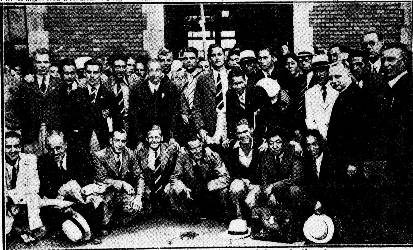
A japán atléták és angol futballisták fogadtatása a debreceni pályaudvaron.

Hétfőn este a nyiregyházi személyvonattal érkezett meg a Bocskai csapata a balti államokban levő túrájáról. A csapat hazafelé hálókocsin tette meg az utat, így elég frissen érkeztek