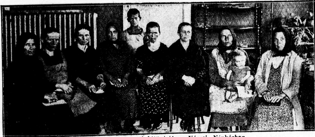
A sokgyermekes családnyak kitüntetése a Városi Népházban.