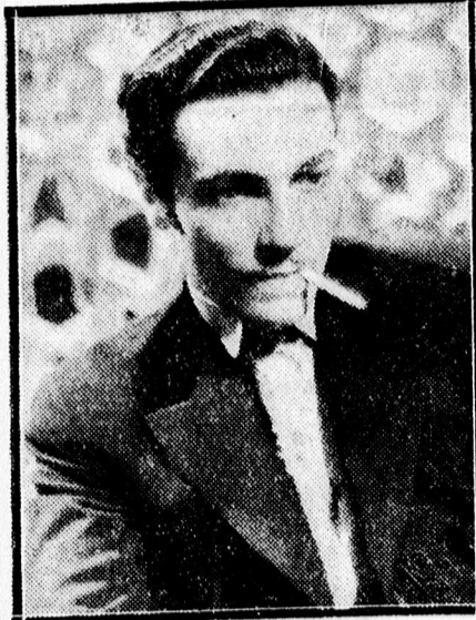
Marlene Dietrich és partnere Caesar Romero a „Nöstény ürdög” főszereplői.

Gumi iskola auktatáska ..... P 5.— Diák tollette csomagok, Cipőtisztítókészlet négy darabból . P —.96 Ruha, haj- és fogkefe fésű, tükör ..... P 1.96 Ötíreses borotvakészlet ..... P 1.60