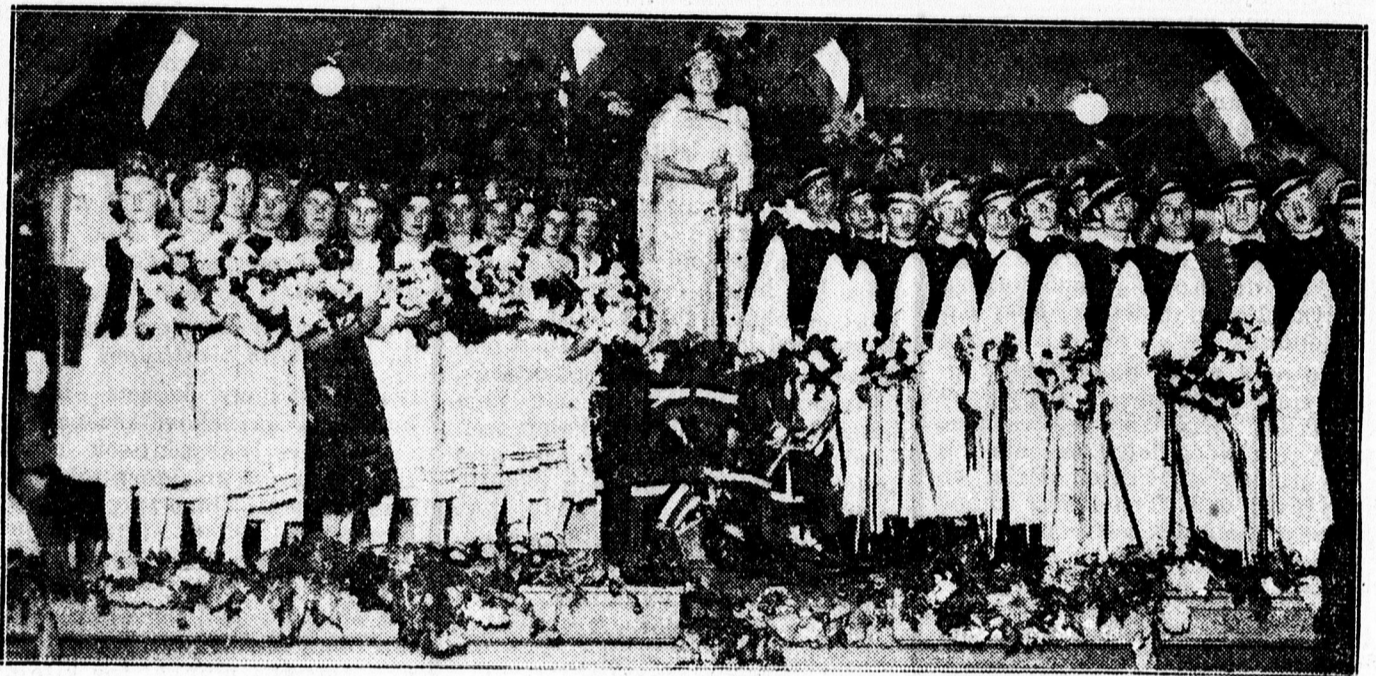
Az egyetemi gépház szüreti multságáról a Korona dísztermében — A hatásos élőkép.