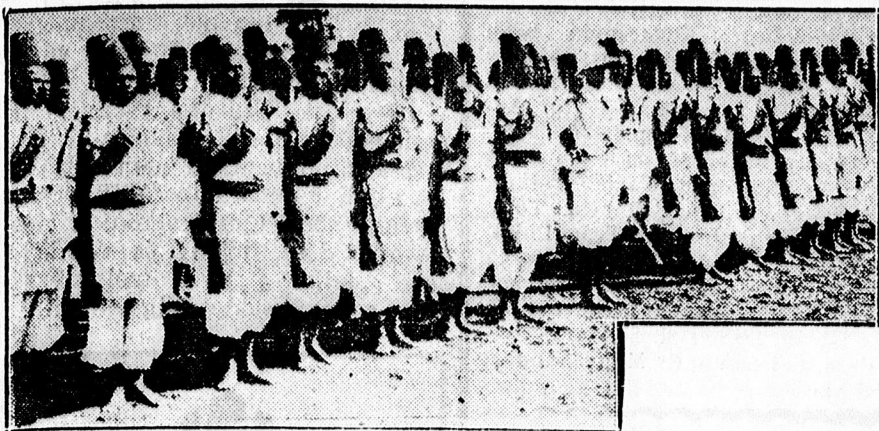
Olasz becsüvált csapatok.

Malvy, a ház pénzügyi bizottságának elnöke határozottan elutasította a gazdasági zárlat tervét, ami szerinte rövidesen általános háborúra vezetne.