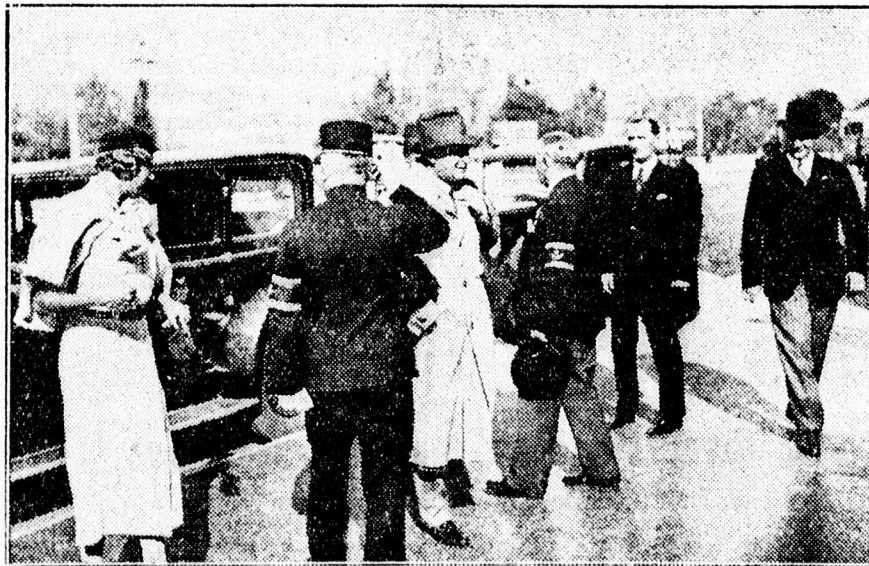
Gömbös miniszterelnök már vasárnap délelőtt elutazott Debrecenből. Képiünk: a miniszterelnök megérkezik az állomás elé, hol sínautó várta.

— Azt tartom, hogy nekünk dezent realizált magyar életre kell gondolnunk!