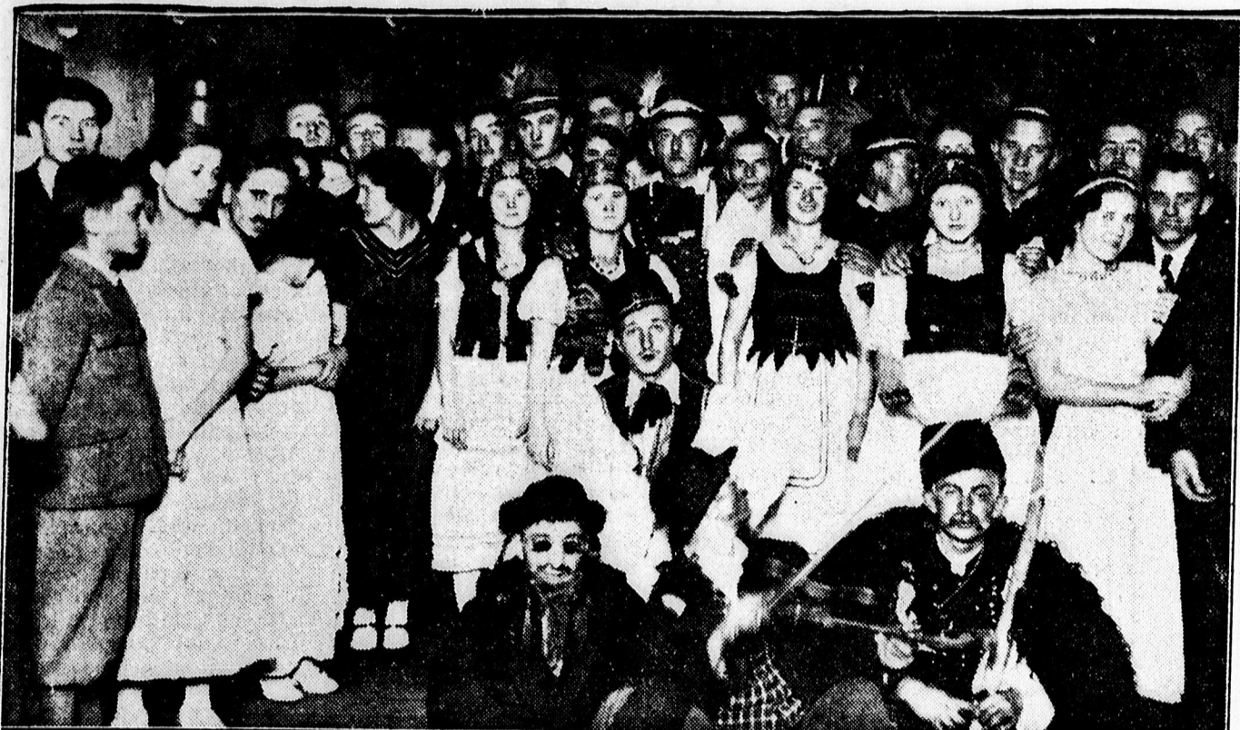
A görög katolikus L. egényegylet szüreti multságáról. A közönség egy része.