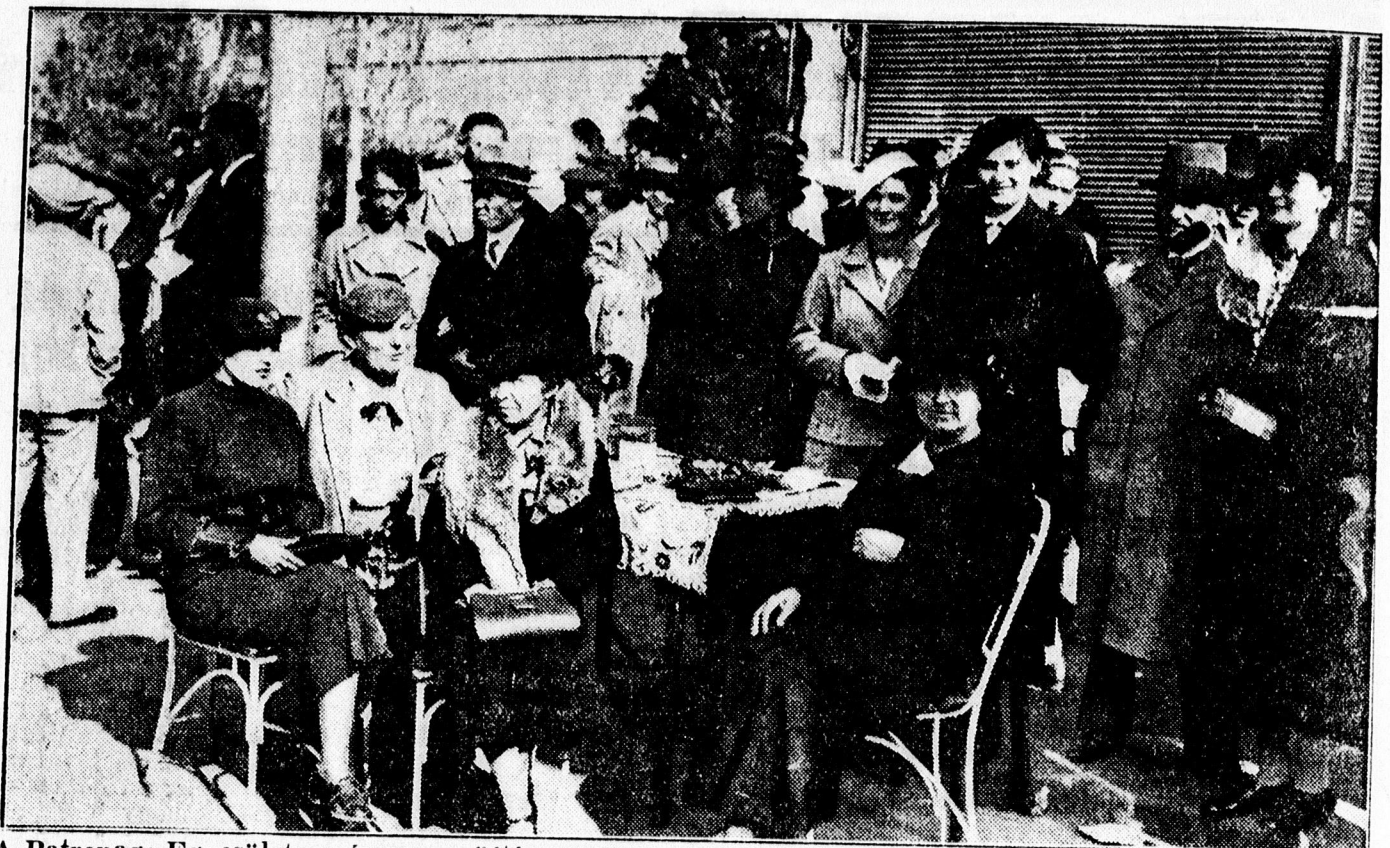
A Patronage Egyesület vasárnap gyűjtést rendezett szép sikerrel. Képünk egyik a Csapó uca sarkán levő urna hölgybizottságát ábrázolja az érdeklődőkkel együtt.

— A nyilastelepi autóbusszjáratokra vonatkozó helyszíni tárgyalás elrendelése. Az 1930:XVI. t. c. 10. §-a értelmében közhírré teszem, hogy a Debreceni Helyi Vasut Rt. üzletigazgatóságának a nyilastelepi lakosság közbenjárása folytán benyújtott kérelmére a Nyilastelepről a Kossuth uccán át a Burgundia uccáig egyelőre próba-időre tervezett rendszeres autóbussz járatok engedélyezése tárgyában 1. hó 16-án, szerdán délután 4 órakor a helyszínen nyilvános tárgyalást tartok, amely tárgyaláson az érdekeltek megjelenhetnek és ott észrevételeiket vagy óhajaikat szóban vagy írásban előadhathatják. Illetve benyújthatják. Polgármester h.