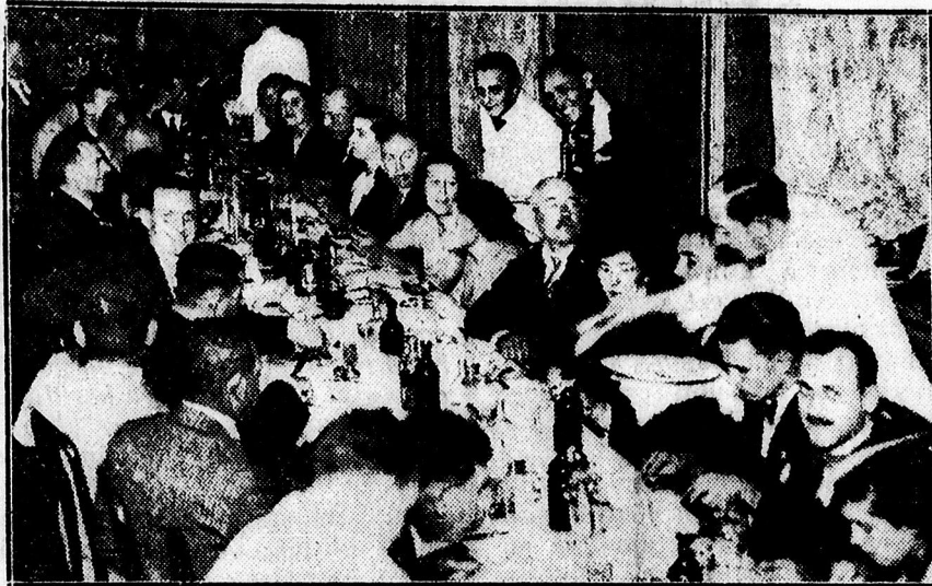
A sütőszakosztály bankettjéről.