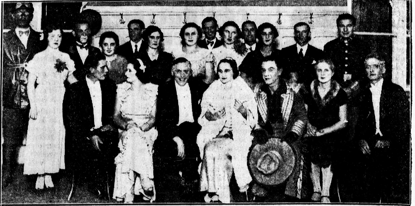
A vagonjárái műkedvelők nagy sikerrel adták elő Gróf Rinaldó című darabot, Képünkön a szereplők