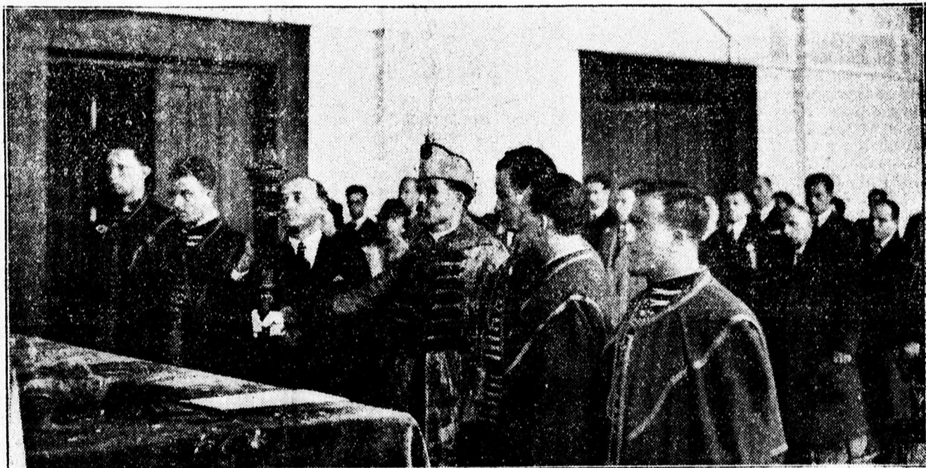
AZ ÚJ DOKTOROK.

Az ODOLO megakadályozza az erjedő és rothadó folyamatokat a szájban, az ODOLO megszünteti a száj rossz szagát, az ODOLO feloldja a fertőzést nátha, torokfájás, influenza és más hasonló veszedelmek esetében.