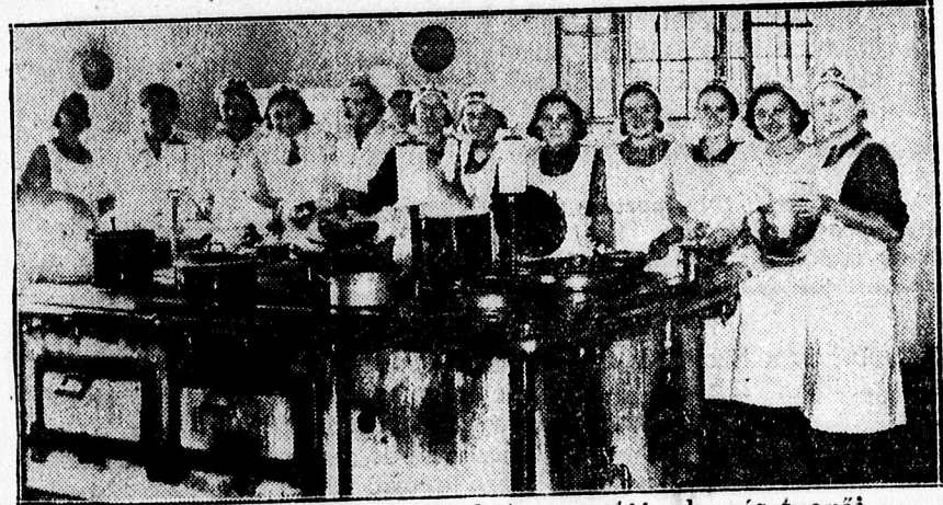
A háztartási tanfolyam két csoportjának résztvevői.

előben határozta el annak idején a földművelésügyi minisztérium, hogy kebelében több vándor háztartási tan- folyamot rendez, mely vándortanfolyamok teljes felszereléssel, konyhai és háztartási cikkekkel útra kelnek, amikor is varrógéptől kezdve a teríté- si eszközökig mindent visznek magukkal és az ország egyes községeiben, városaiban ültik fel sátorfájukat és hat héten keresztül adnak szakok- tatást a háztartás minden ágában azoknak a leányoknak, akik otthon nem sajátíthatják el a fontos háztar- tási teendőket. Hogy milyen nagy je- lentősége van ezeknek a vándortan- folyamoknak, azt nem lehet ennek a cikkek keretében eléggé elmondani, de mindenki belátja és tudja, aki egy kieszt is nyitott szemmel néz szíjjel a mai életben.