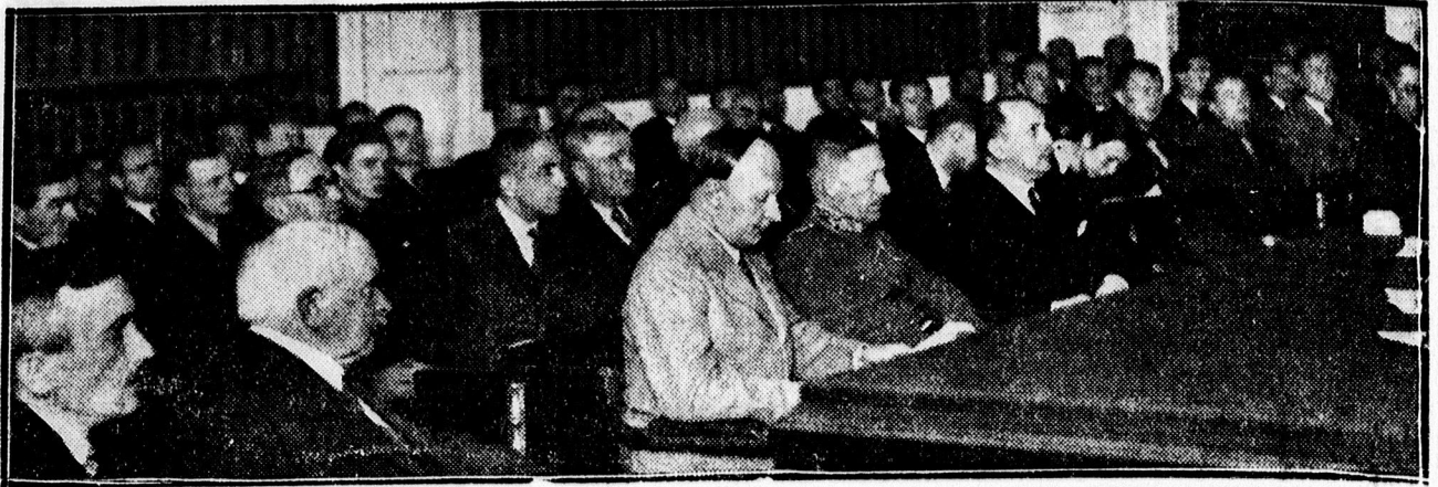
Közönség egy része a Baross Gábor Kör alakuló gyűléséről.