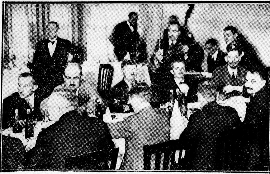
Iparosok bankettje az Arany Bika Boeskaik termében.