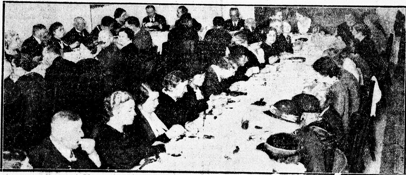
A Kossuth ucai egyházzrész vacsorája a Dóczy intézetben.