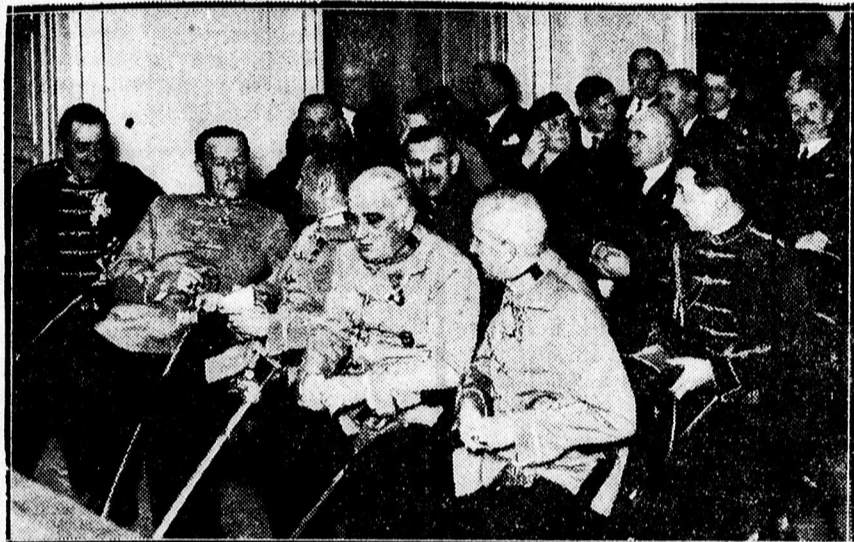
A B. B. V. C. diszközgyűlésének közönsége.

A jubileumi ünnepséget diszközgyűlés nyitotta meg a Déri múzeum előadótermében, amelyet elő-