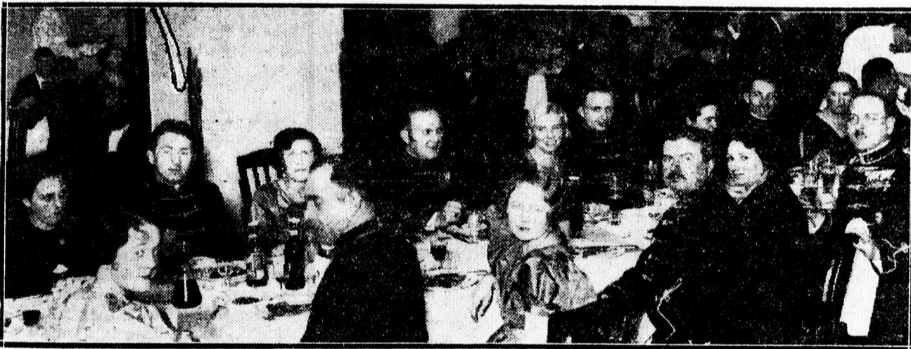
A B. B. V. C. jubileuma alkalmával rendezett vacsora a Bikában.