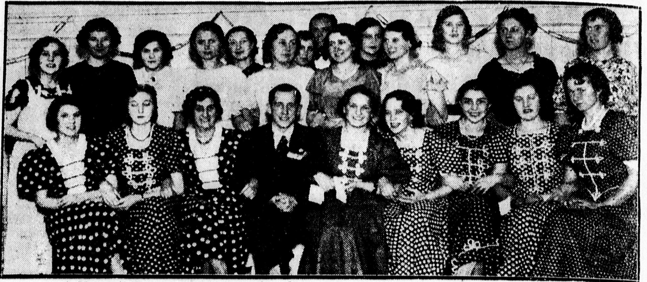
A Nemzeti Egység Leánycsoportja által rendezett „András és Mikulás” est szereplői.

— Fogorvoslás, Piac uca 5. Tömés 2 pengő, műfogak 2 pengőtől, foghúzás díjtalan. Davidovits ál. vizsg.