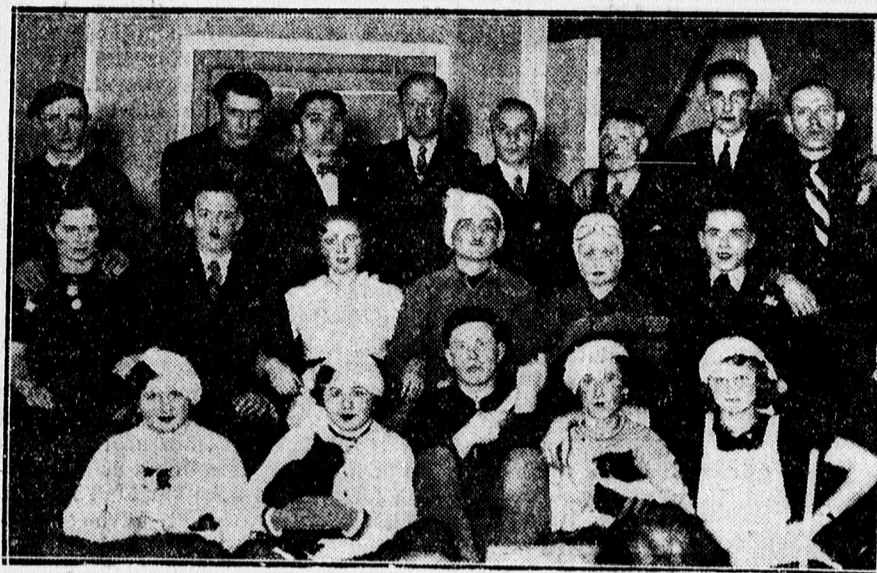
„Zsákba maeska“ szereplői a Homokkerti Olvasókörben.

Újpest görög földön, Athénben az Olimpikos ellen 1 : 0 arányban győzött, míg a Panatios ellen 1 : 1