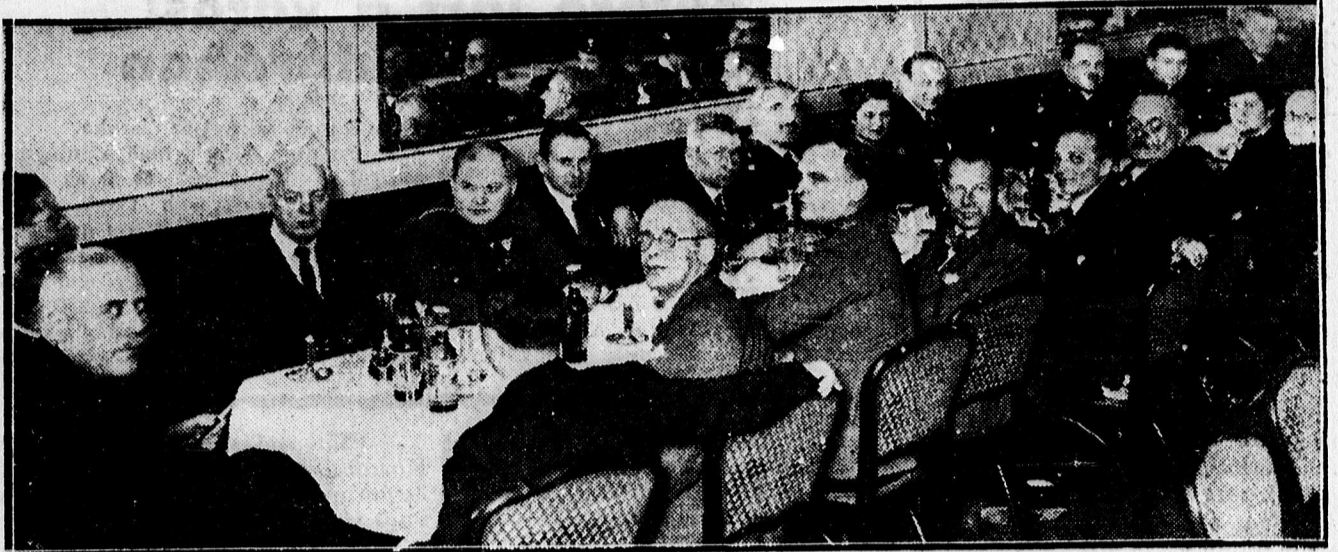
Piarista Diákszövetség összejövetele az Angol Királynőben.

NYOMTATVANYAIT a lapunkat előadó a nyomdájában TISZÁNTULI KÖNYV- ÉS LAPKIADÓ RT. NÉL. rendelje!