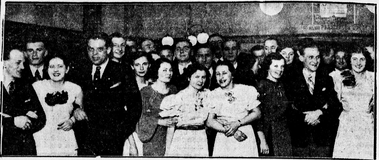
Táncoló párok a Piarista Diákszövetség estélyén.

— Az Iparos Dalegylet teastélye. Az Iparos Dalegylet, folyó hó 8-án, szombaton este 8 órakor, az iparistület dísztermében és az iparoskör összes helyiségeiben, Simonffy ucca 10. második emelet, közkívánatra tartja meg nagyszabású teastélyét, a vigalmi bizottság lázas tevékenységét fejte ki, hogy kedves vendégeinek egy kellemes és feledhetetlen estét szerezzen a dalegylet újonnan betanult darabokat foglalani és egy elsőrendű iparos ifjakból szervezett zenekar fogja szórakoztatni a megjelenőket. Kérjük az egyeletünk barátait, hogy a családi jellegű estélyünkön minél számosabban szíveskedjenek eljönni. Olcsó ételekről és italokról gondoskodik a... — Előjegyzés.