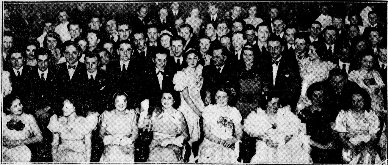
Az Arany Bikában tartott Szent László estély iatalsága.