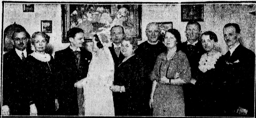
Az új pár és a násznép.

A fiatal pár a délutáni gyorsvonattal nászutra ment, még pedig Budapest—Bécs—Salzburg programmal.