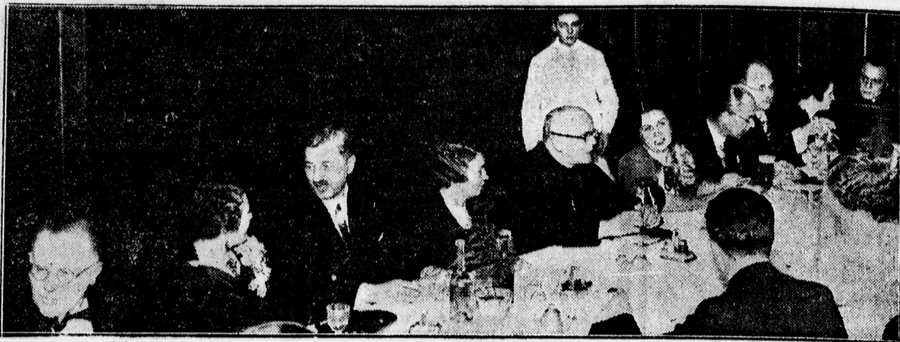
Előkelőségek a Szent László teastélyen.

— KIE mesedélután a Nyilas'elepen. Február hó 16-án, vasárnap délután félöt órakor a KIE nyilastelepi csoportja a gyülekezési otthon nagytérképében, vetített képi mesedélután rendez, amelyre a gyermekeket ezúton is meghívja a vezetőség.