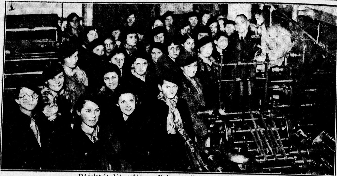
Dóczisták látogatása a „Debreczen“ nyomdájában.

— Az artistakirályok regényes élete. A porond királyainak regényes életé- ről, pompás képekkel illusztrált cikk- ben számol be a Délbáb új száma.