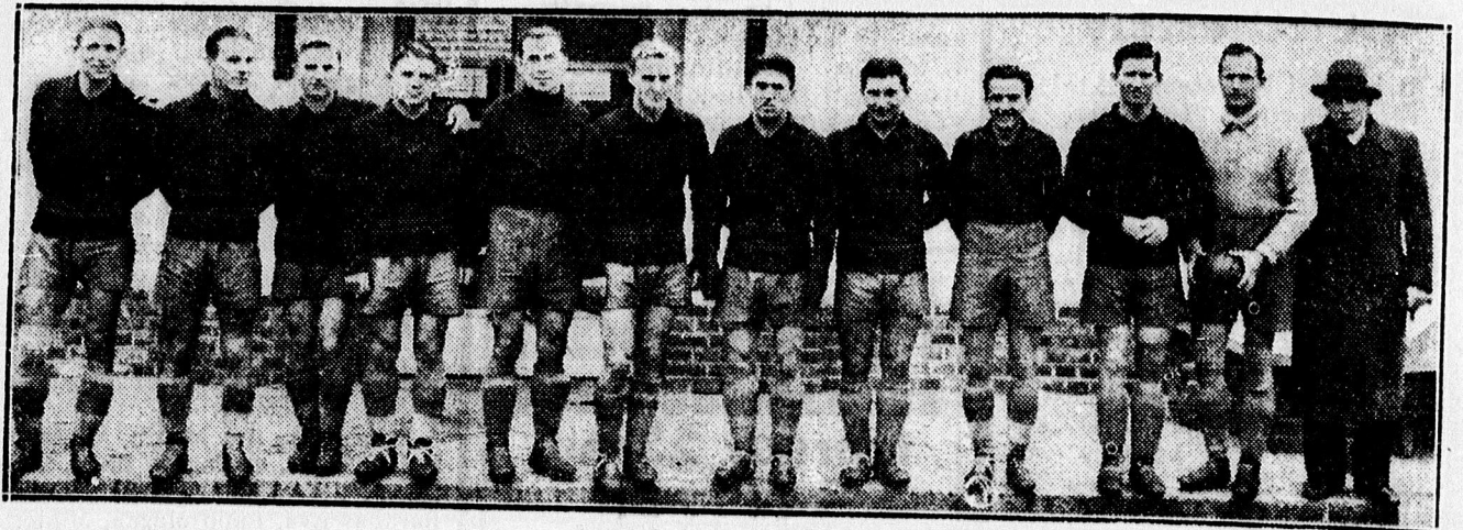
A győztes Boeskaí csapata.