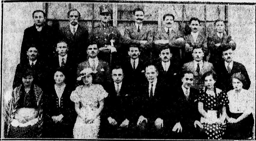
A hajduböszörményi gör. kath. ifjúsági egyesület tagjai előadták nagy sikerrel a „Pünkösdi menyasszonyok” című népszínművet. — Az előadás szereplői.