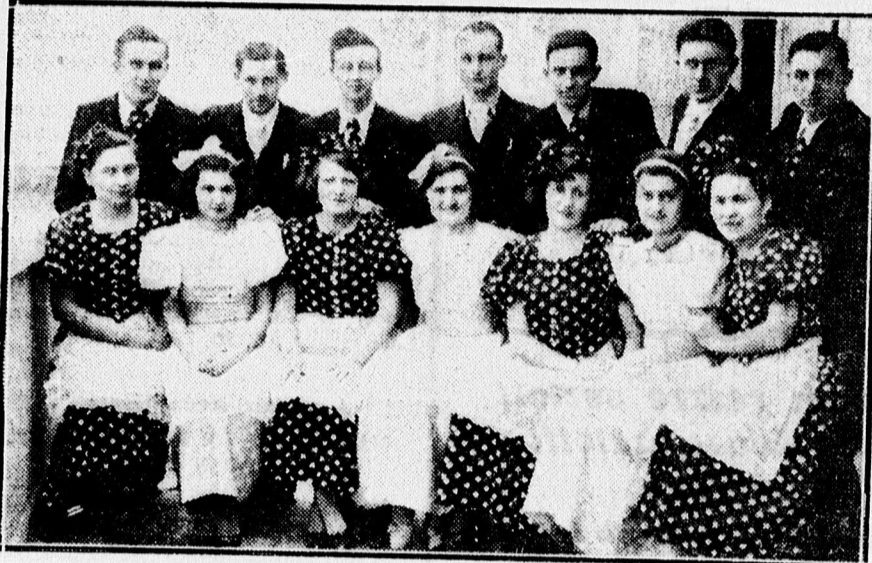
A balmazújvárosi Pettyes-bálról.

A sétatánc muzsikájából eszárdásba esapott a cigány vonója és kellemes hangulatban reggelig együtt maradt a pettyes-bál közönsége.